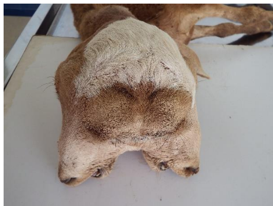
Figura 1. Diprosopia em um ovino proveniente de São João do Cariri- PB.

Nos caprinos oriundos da cidade de Gurjão, foram observados artrogripose, flexura permanente dos membros pélvicos e torácicos, escoliose das vertebrae torácicas e lombares (Figura 2).