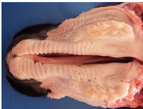
Figura 4. Palatosquise em uma bezerra neonata, proveniente de Areia- PB.

Uma bezerra de seis meses oriunda do município de Serra Branca apresentou meningocele caracterizada por saculação na região occipital da cabeça (Figura 5). As membranas que formavam a saculação na região occipital tinham ligação com a cavidade craniana através de uma abertura na região occipital. Essas membranas representavam uma continuidade da dura-máter, comprovando tratar-se realmente de meningocele. Ao exame histológico, as membranas eram constituídas por tecido conjuntivo com disposição longitudinal, entremeado por numerosos vasos sanguíneos, semelhante à meninge que recobria o encéfalo. As alterações encefálicas encontradas foram ausência do verme cerebelar, dilatação do 4º ventrículo, ausência do corpo caloso e dilatação dos ventrículos laterais que se comunicavam com o terceiro ventrículo, formando uma única cavidade.