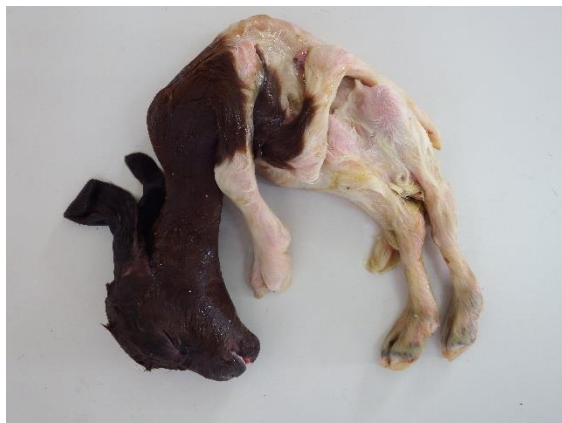
Figura 3. Artrogripose e escoliose em um caprino proveniente de Pau dos Ferros – RN.

Uma bezerra neonata proveniente de Areia foi remetida para necropsia. As alterações foram caracterizadas por hiperextensão dos membros pélvicos, flexura dos torácicos (artrogripose) e presença de palatosquise (figura 4).