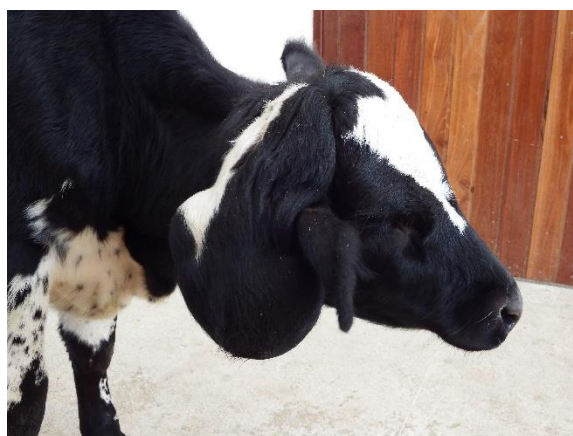
Figura 5. Bezerra de seis meses com meningocele, proveniente de Serra Branca- PB.

Uma bezerra de seis meses oriunda do município de Serra Branca apresentou meningocele caracterizada por saculação na região occipital da cabeça (Figura 5). As membranas que formavam a saculação na região occipital tinham ligação com a cavidade craniana através de uma abertura na região occipital. Essas membranas representavam uma continuidade da dura-máter, comprovando tratar-se realmente de meningocele. Ao exame histológico, as membranas eram constituídas por tecido conjuntivo com disposição longitudinal, entremeado por numerosos vasos sanguíneos, semelhante à meninge que recobria o encéfalo. As alterações encefálicas encontradas foram ausência do verme cerebelar, dilatação do 4º ventrículo, ausência do corpo caloso e dilatação dos ventrículos laterais que se comunicavam com o terceiro ventrículo, formando uma única cavidade.