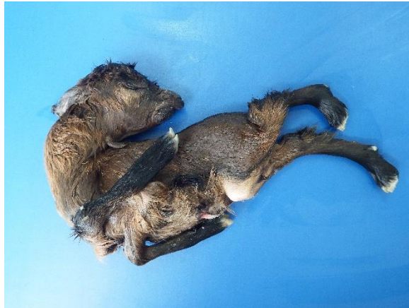
Figura 2. Artrogripose e escoliose em um caprino proveniente de Gurjão-PB.

Nos caprinos proveniente da cidade de Pau dos Ferros, foi registrado aborto e ocorrência de natimortos malformados em 33 fêmeas. Foram remetidos três caprinos para necropsia (dois natimortos e um feto), apresentando malformações caracterizadas por artrogripose e escoliose, no feto foi observado também palatosquise (Figura 3).