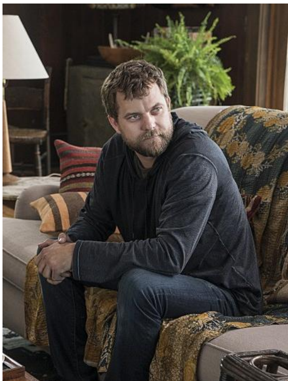
Figura 4 Cole