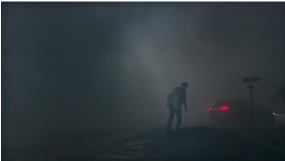
Figura 6, Frame 1, Episódio 12, Temporada 2

distraindo Helen e fazendo com que ela atropеле algo na estrada. A partir desse momento, diante da recusa de Helen e da insistência de Noah em parar o carro, a câmera perde a estabilidade. Durante toda a cena entre o carro e a estrada, a fotografia da série é muito escura e com neblina. Quando Noah sai do carro, com exceção dos elementos cênicos (o carro, com Helen, Noah, o corpo morto de Scott e a placa indicando o caminho do The End), nada mais é visível ao espectador, aumentando a atmosfera de suspense. Além disso, vemos o enquadramento sob um plano geral e todos os elementos que compõem a imagem estão à direita do quadro, divididos pelas faixas amarelas da pista.