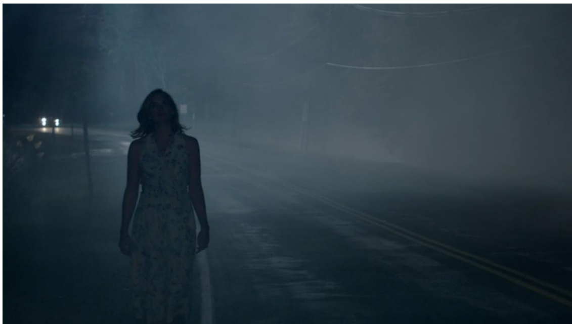
Figura 9 Frame 4, Episódio 12, Temporada 2

Observando os mesmos acontecimentos, mas sob outro ponto de vista, observa-se que Alison caminha sozinha pela estrada. Esse não era um caminho usualmente percorrido a pé pela personagem e, assim como na perspectiva anterior, observa-se uma neblina densa sobre toda a estrada, dificultando a visão de quem está passando, tanto de carro, quanto a pé. A câmera plana e a disposição dos elementos cênicos à esquerda do quadro, ao contrário do que se viu na perspectiva anterior, enfatizam as contradições inerentes a cada ponto de vista.