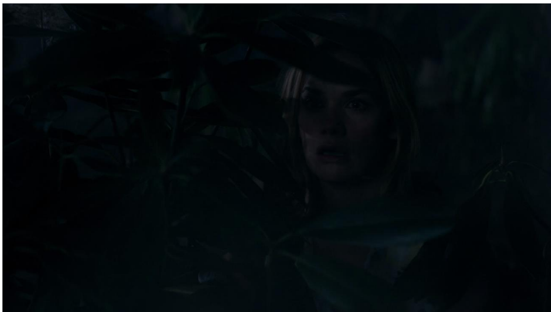
Figura 11 Frame 6, Episódio 12, Temporada 2