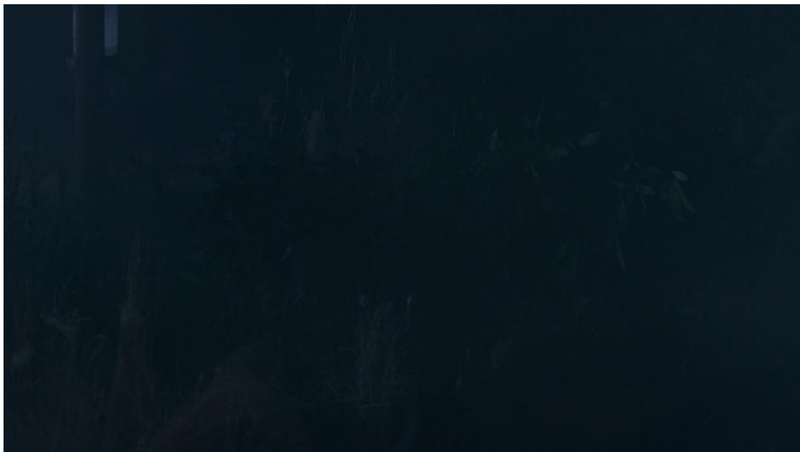
Figura 8 Frame 3, Episódio 12, Temporada 2

Porém, é interessante comentar que Noah, antes de voltar para o carro e ir embora com Helen, olha em direção à floresta duas vezes. Nesses dois momentos a câmera assume, brevemente, uma posição subjetiva.