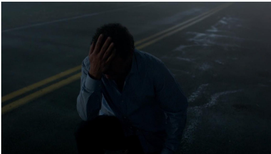
Figura 7 Frame 2, Episódio 12, Temporada 2