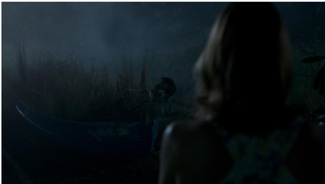
Figura 10 Frame 5, Episódio 12, Temporada 2

A fotografia utilizada nos planos que envolvem a morte de Scott contrasta muito com o resto do episódio, assim como a série no geral. Essa escuridão dá uma atmosfera de sonho, quase como em um filme de terror, e o espectador precisa de certo grau de esforço para enxergar os personagens devido ao tom escuro e a densidade da neblina. A mudança na fotografia da série também é visível nos momentos de flashforward , nos quais o tom das imagens é mais hermético, ligeiramente acinzentado, destacando-se em relação às cores quentes do verão de Montauk, predominando forte luz natural e ao tom ligeiramente azulado do inverno, além das cores intensas e o uso do contraste presentes nas cenas gravadas em Nova York.