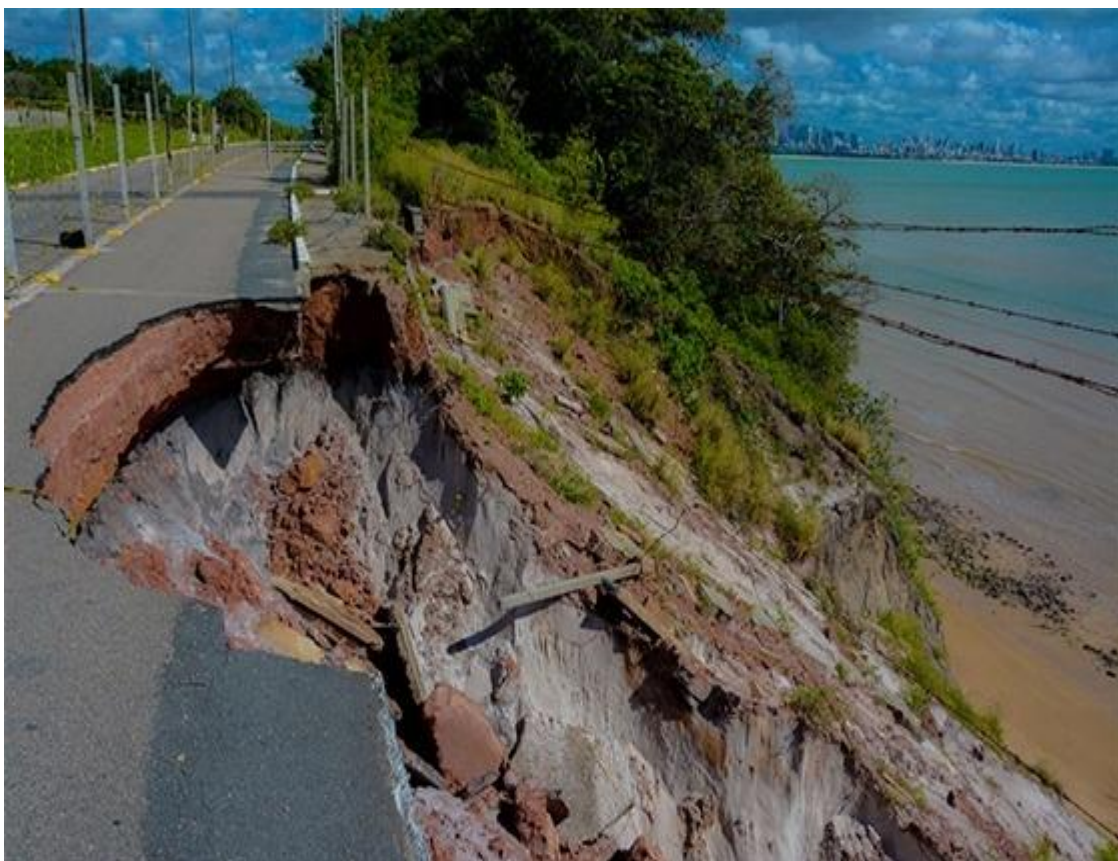
Figura 4 – Atual situação da Barreira do cabo Branco.

A atual situação da Barreira do Cabo Branco preocupa a todos que passam em suas imediações, pois há o risco constante de desabamento. Este fato fez com que as autoridades, em medida emergencial de segurança da população, isolassem a área.