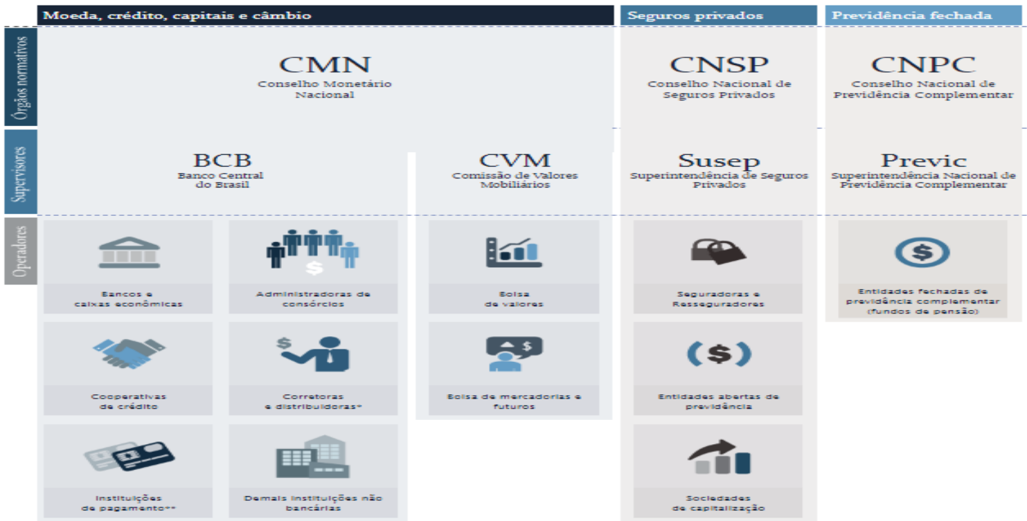
Figura 5: Composição e segmentos do Sistema Financeiro Nacional

Contudo, vemos o desenvolver do sistema financeiro nacional e sua composição, em equilíbrio com seus órgãos que o ajudam na atividade financeira do país em uma escala harmônica entre seus agentes que compõem seu quadro de agencias regulador, conforme a tabela a baixo;