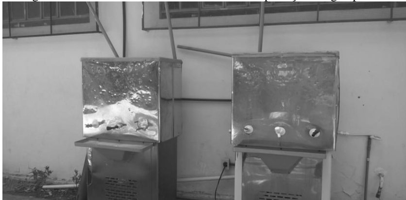
Figura 4 - Torneiras de bebedouros abertas desperdiçando água potável