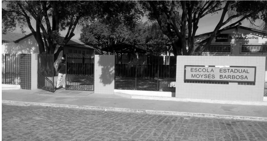
Figura 2 - Organização Aprendente Educativa Moisés Barbosa na cidade de Petrolina-PE

Como já relatado em outro momento deste estudo, merece que nesta organização aprendente, seja estruturada e delineada a educação, que tenha como foco a consumo responsável, como se apresenta nos registros fotográficos. É preocupante as práticas de desperdício e consumo irresponsável dos participantes dessa organização. Qualquer pessoa, com senso de responsabilidade com o meio ambiente, logo ficará preocupada com o que se vê em relação ao uso da energia elétrica sem o menor cuidado, a produção do lixo sem medir as consequências, a utilização da água potável e doce jorrando para o esgoto, o não zelo pelas plantas e árvores que, dentro do espaço de aprendizagem, fazem um bem não só no sentido de promover sombras, mas também na garantia de uma ventilação natural tão necessária para o clima presente no sertão pernambucano do Nordeste brasileiro. Ainda, existe o agravante que é a produção de lixo de papel do caderno dos estudantes. Nessa organização, destacam-se folhas utilizadas e não utilizadas, por parte dos estudantes e jogarem-nas no chão tem sido uma prática comum em todas as salas e em todos os turnos.