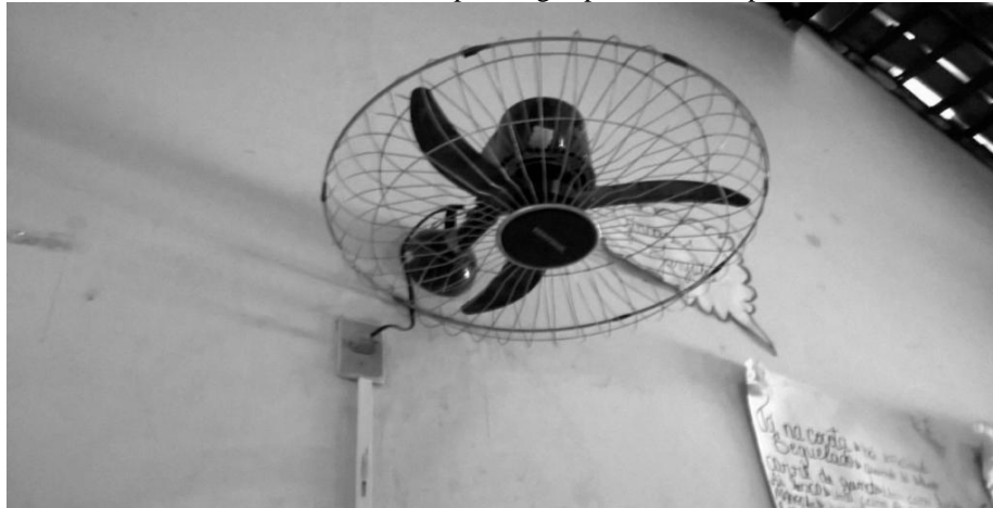
Figura 8 - Ventiladores em funcionamento por longos períodos, independente das necessidades