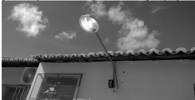
Figura 5 – Lâmpada acesa durante o período diurno na organização aprendente

A situação que se apresenta nessa organização em relação ao consumo é estarrecedora. Além dos elementos enumerados anteriormente, ainda, é visível a presença as lâmpadas acesas em corredores com iluminação natural de excelente qualidade. É notório, no espaço reservado para cozinhar, que lá há ventilação e iluminação natural; mas as luzes permanecem acesas sem nenhuma justificativa convincente e pertinente durante o dia todo, todos os dias de funcionamento da escola, pois, para conhecimento e informação, essa unidade abre às 6h30min da manhã e fecha às 22 horas. Somente na cozinha são acesas 4 lâmpadas sem necessidade durante 16h30 minutos.