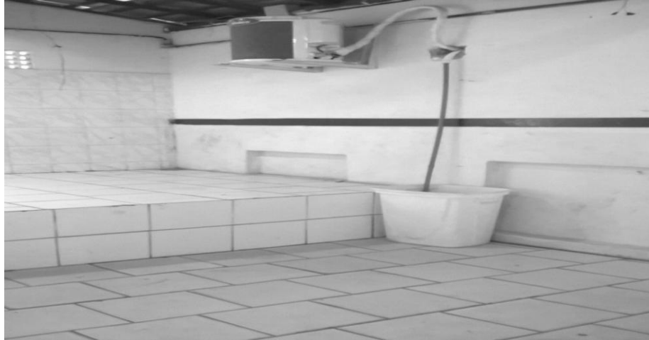
Figura 7 – Água gerada pelo ar-condicionado é desperdiçada, quando poderia ser reaproveitada