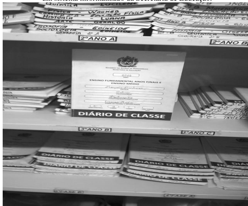
Figura 6 - Duzentos e sessenta diários são utilizados anualmente, quando poderiam ser substituídos por um sistema informatizado da Secretaria de Educação.