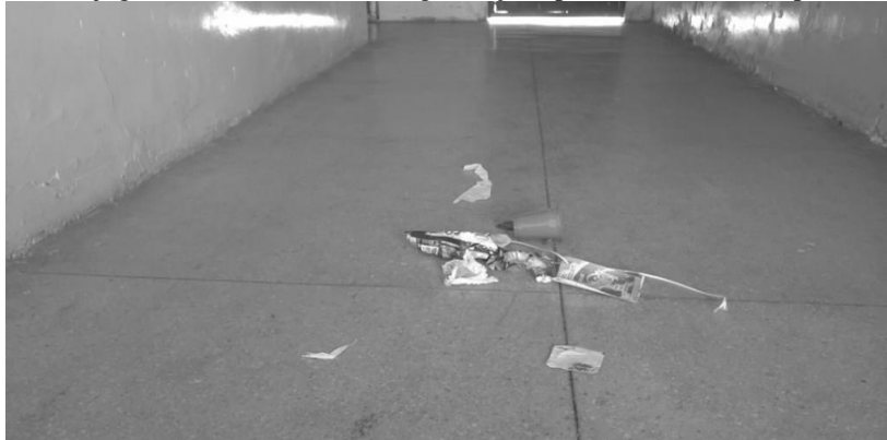
Figura 3 - Lixo jogado nos corredores da organização aprendente durante o período de aulas.

Uma das práticas sem responsabilidade é, de fato, o uso da água potável e doce quando são utilizadas nos banheiros para o uso de esgoto, pois se encontram com caixas de armazenamento com fissuras e a água é esbanjada sem limites do tempo, as torneiras, no mesmo espaço, gotejam aos poucos sem as devidas providências.