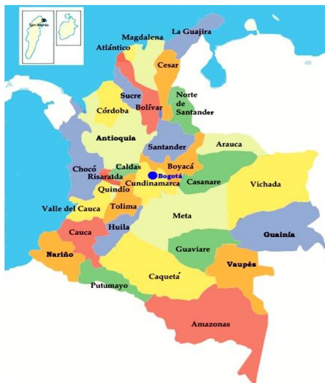
Figura 1 - Mapa da Colômbia por