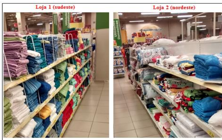
Figura 2: Imagens de pontos de vendas da toalha Confort

Pouco tempo após o seu lançamento, as toalhas Confort já eram vendidas, exclusivamente, nas principais lojas especializadas em cama, mesa e banho em todo o território nacional, principalmente nas regiões sudeste e nordeste do Brasil. Com relação à exposição das toalhas nos pontos de vendas, as seções das lojas destinadas ao produto eram praticamente semelhantes, independente da região. Em comum, as toalhas das diversas marcas eram amontoadas em prateleiras (Figura 2), por vezes desorganizadas, dificultando a distinção entre elas, a visualização da marca e a percepção dos atributos do produto.