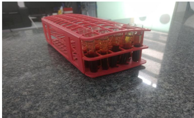
Figura 2. Amostras de sangue em seus respectivos tubos de ensaio.

As amostras foram colhidas por meio de venopunção da veia jugular externa, utilizando-se seringas descartáveis de 3mL e tubos de ensaio de vidros (Figura 2). Depois de identificadas, as amostras foram acondicionadas e encaminhadas ao laboratório de Medicina Veterinária Preventiva, UFPB Campus II, Areia, onde foram centrifugadas para obtenção do soro, que foi alocado em tubos individuais para posterior congelamento até os exames.