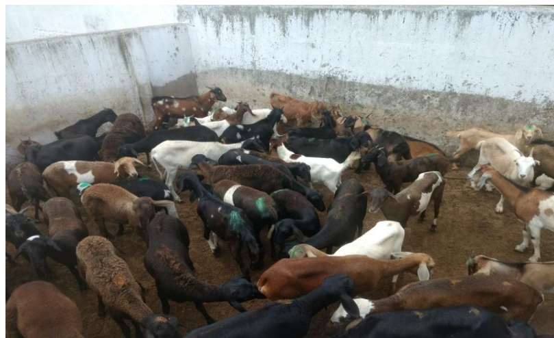
Figura 1. Curral de espera do abatedouro municipal de Esperança – PB.

A colheita de sangue foi realizada no curral de chegada pré-abate em intervalos semanais, totalizando 9 (nove) semanas ao todo, no período de 29 de setembro a 24 de novembro de 2017. A seleção dos animais foi aleatória, sendo escolhidas de 11 a 15 animais por visita, de cada espécie, perfazendo um total de 245 amostras, sendo 123 da espécie caprina e 122 da espécie ovina.