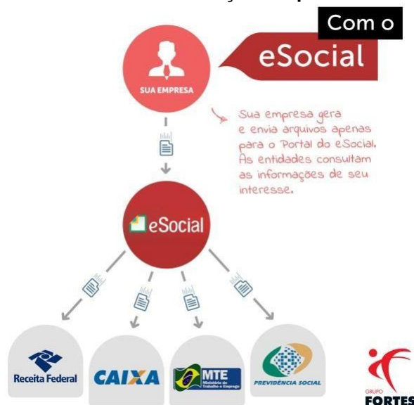
Figura 2 - Envio das Informações Depois do eSocial