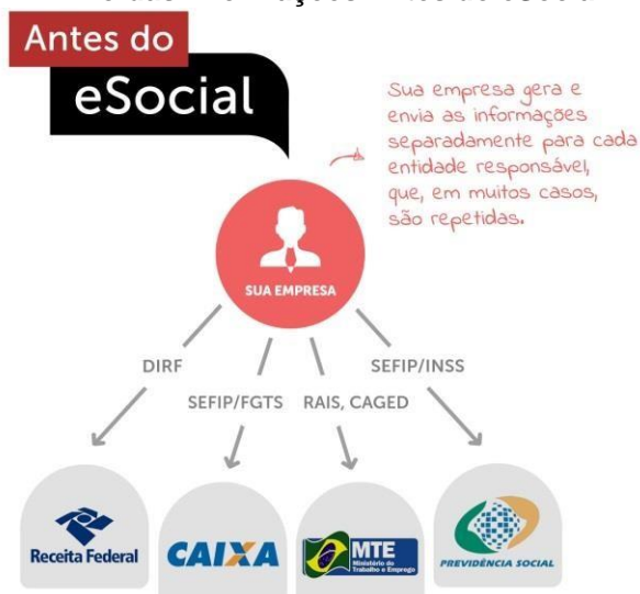
Figura 1 - Envio das Informações Antes do eSocial