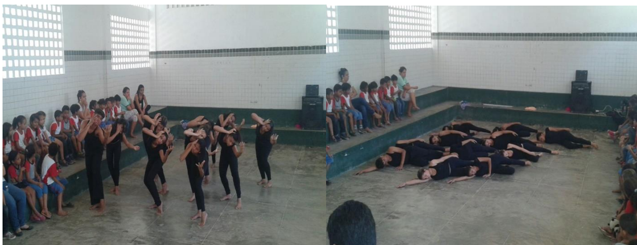
Figuras 4 e Figura 5: Imagens finais do espetáculo Violência .

A apresentação ocorreu no pátio da Unidade de Ensino onde a pesquisa foi desenvolvida e o público era composto por crianças do Ensino Fundamental I, entre seis e onze anos. Entre as falas do público, apareceram: “homem não pode bater em mulher”, “um amiguinho não pode machucar o outro” e até mesmo “meu pai também puxa o cabelo de minha mãe como esse menino (apontam para o componente do grupo) puxou da menina (também componente do grupo), e eu choro” e, por fim, “eles estão mortos por causa das brigas”, comentário de uma aluna do 3º ano, quando os integrantes entram hipnotizados pela música e não expressam nenhuma emoção em seus rostos nos momentos finais da coreografia, como mostram as imagens abaixo.