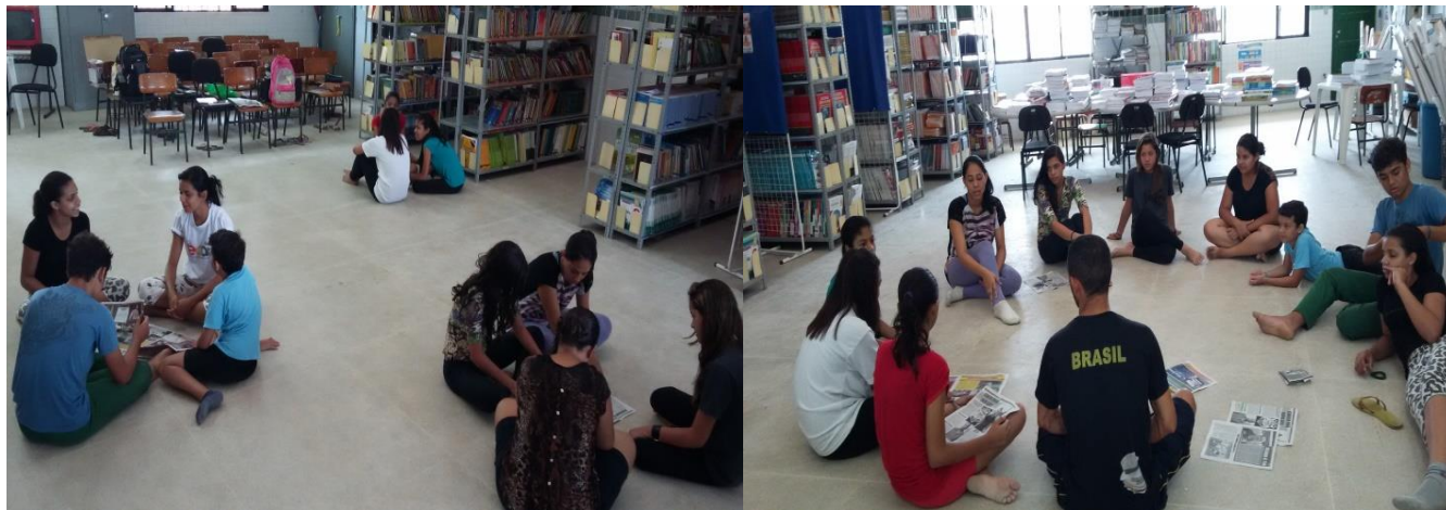
Figura 1 e Figura 2: Pesquisa e discussão sobre violência através de matérias de jornais.

As imagens abaixo retratam os momentos tanto da pesquisa quanto das discussões sobre a abordagem descrita acima.