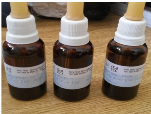
Figura 1: Preparados homeopáticos utilizados