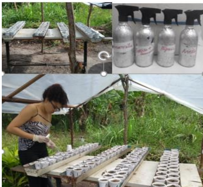
Figura 3: Aspecto da área do experimento e detalhes dos vasos utilizados

Um dia após o plantio foram iniciadas as pulverizações de oito em oito dias dos preparados homeopáticos. Foram utilizados pulverizadores para cada tratamento na capacidade de 350 ml. Em cada um foram adicionados 0,35 ml/350ml de água destilada de cada preparado homeopático. As regas com água potável ocorreram a cada dois dias.