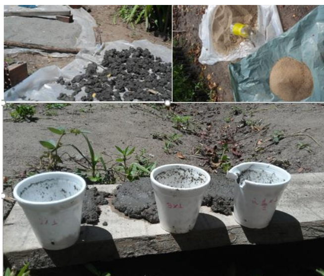
Figura 2: Aspecto dos componentes do substrato utilizado.

O substrato resultou da mistura de 2,5 partes de Areia Lavada de rio peneirada e 1,0 parte de Pó de Rocha. Esta mistura resultou de diversos testes preliminares de drenagem e consistência de torrão. O Pó de Rocha foi obtido da indústria de processamentos de rochas ornamentais Fuji, localizada em Campina Grande, Paraíba, sendo resultante da composição de pó de granito preto, bentonita e limalha de ferro. Os substratos isolados de Areia Lavada Pura e Pó de Rocha Puro não apresentaram características positivas quanto a drenagem e consistência de torrões o que motivou a não utilização dos mesmos para efeitos comparativos.