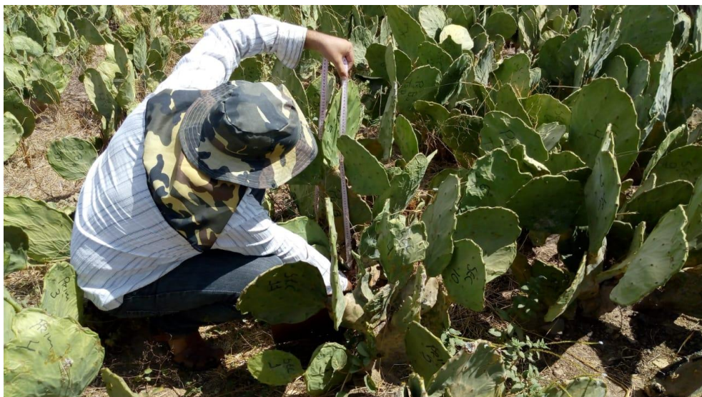
Figura 6: Medição de altura da planta

Cada parcela foi podada na primeira semana dos meses de julho, agosto, setembro, outubro e novembro de 2018. Em cada planta útil antes da poda foram avaliados: Altura da planta com o uso de fita métrica; Número total de raquetes por contagem; Número de raquetes por ordem e marcação com pincel atômico; Comprimento das raquetes colhidas e não colhidas com o uso de fita métrica; Largura das raquetes colhidas e não colhidas com o uso de fita métrica e Peso das raquetes colhidas com o uso de balança digital. A altura das plantas foi medida do nível do solo até o ápice da raquete que estava em maior altura na planta, como observado na figura 6.