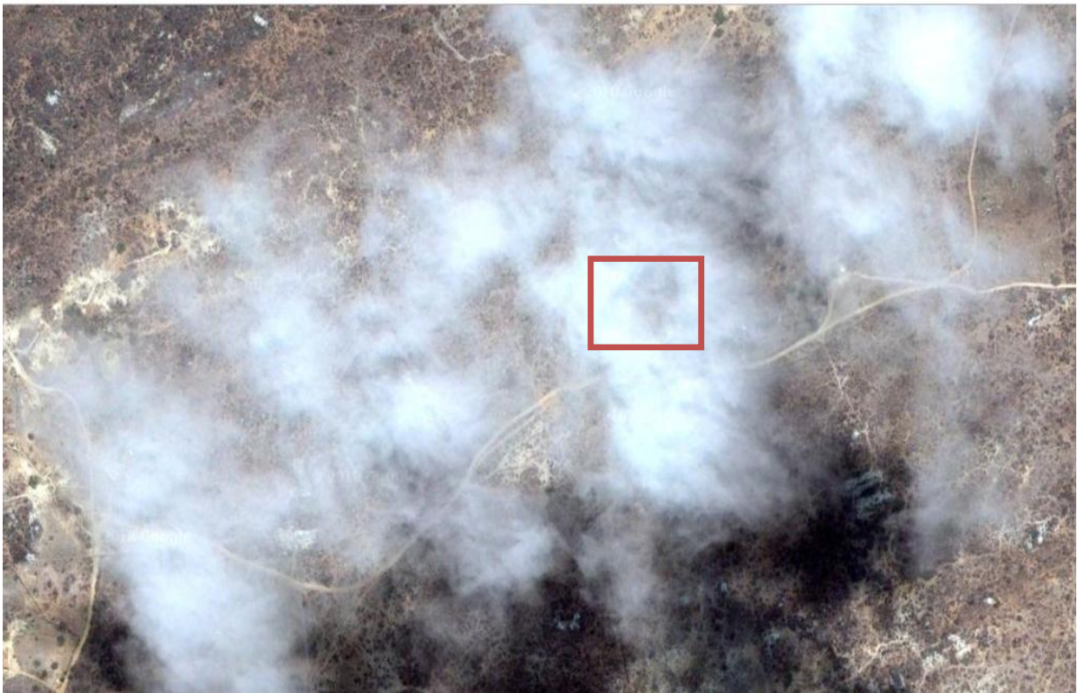
Figura 1: Localização do experimento

O experimento foi conduzido de julho de 2018 a novembro de 2018, no Sítio Pedra da Inveja, município de Barra de São Miguel, com latitude 7°44'22" S, longitude 36°16'50" O, localizado na Mesorregião da Borborema e na Microrregião do Cariri Oriental do estado da Paraíba, Bioma Caatinga e Bacia Hidrográfica do Rio Paraíba do Norte. O clima o Tropical-semiárido com média pluviométrica anual de 461,3 mm e temperatura média anual de 23,2 °C.