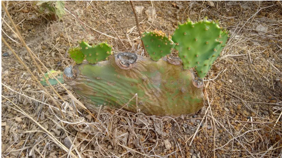
Figura 10: Planta emitindo novas brotações