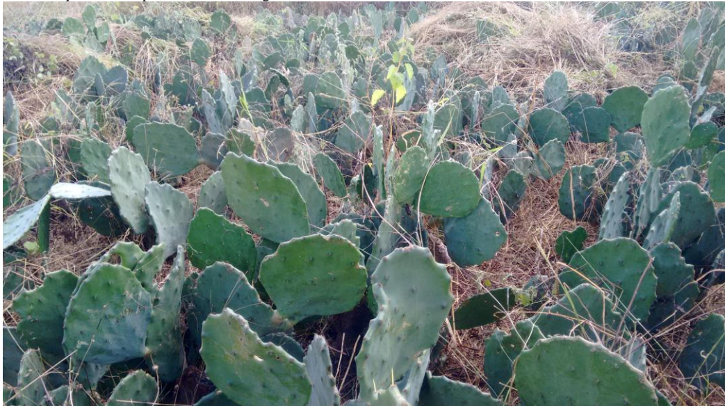
Figura 4: Área sendo capinada