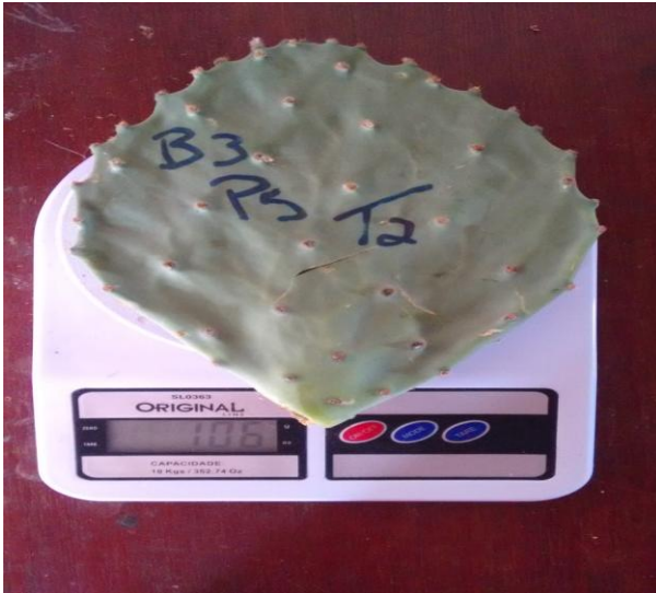
Figura 7: Pesagem das raquetes

Depois de feita a medição da altura, com uso de fita métrica, os cortes foram iniciados de acordo com seu respectivo tratamento, a coleta foi realizada planta a planta de forma individual para não ocorrer erros no momento da obtenção dos dados. As raquetes eram levadas após o corte para serem pesadas em uma balança digital (Figura 7), em seguida eram medidos a largura e o comprimento das mesmas (Figura 8).