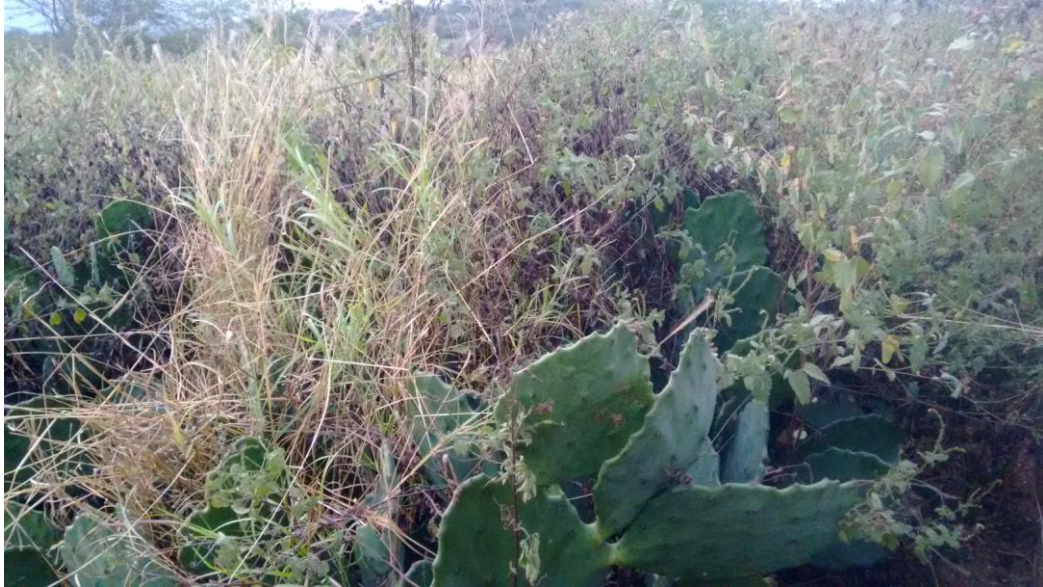
Figura 3: Área antes da capina