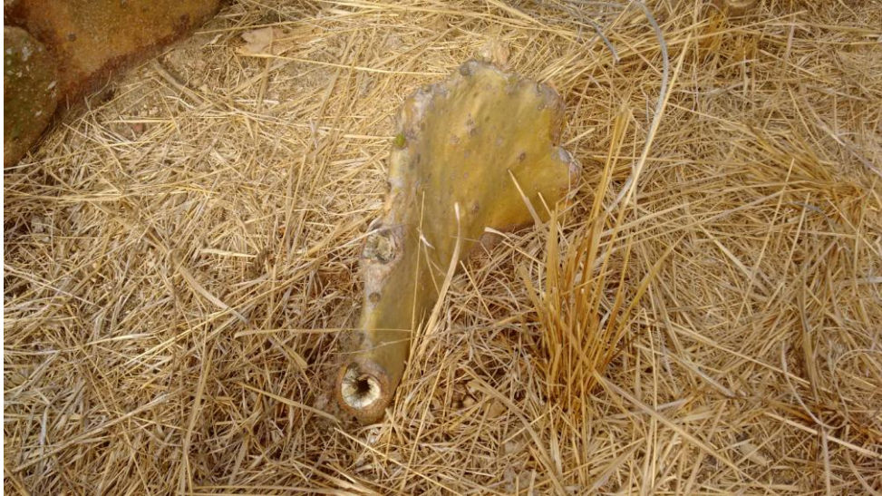
Figura 9: Planta após a poda