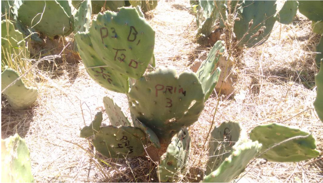
Figura 5: Identificação das raquetes na planta