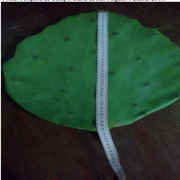
Figura 8: Medição de altura da raquete