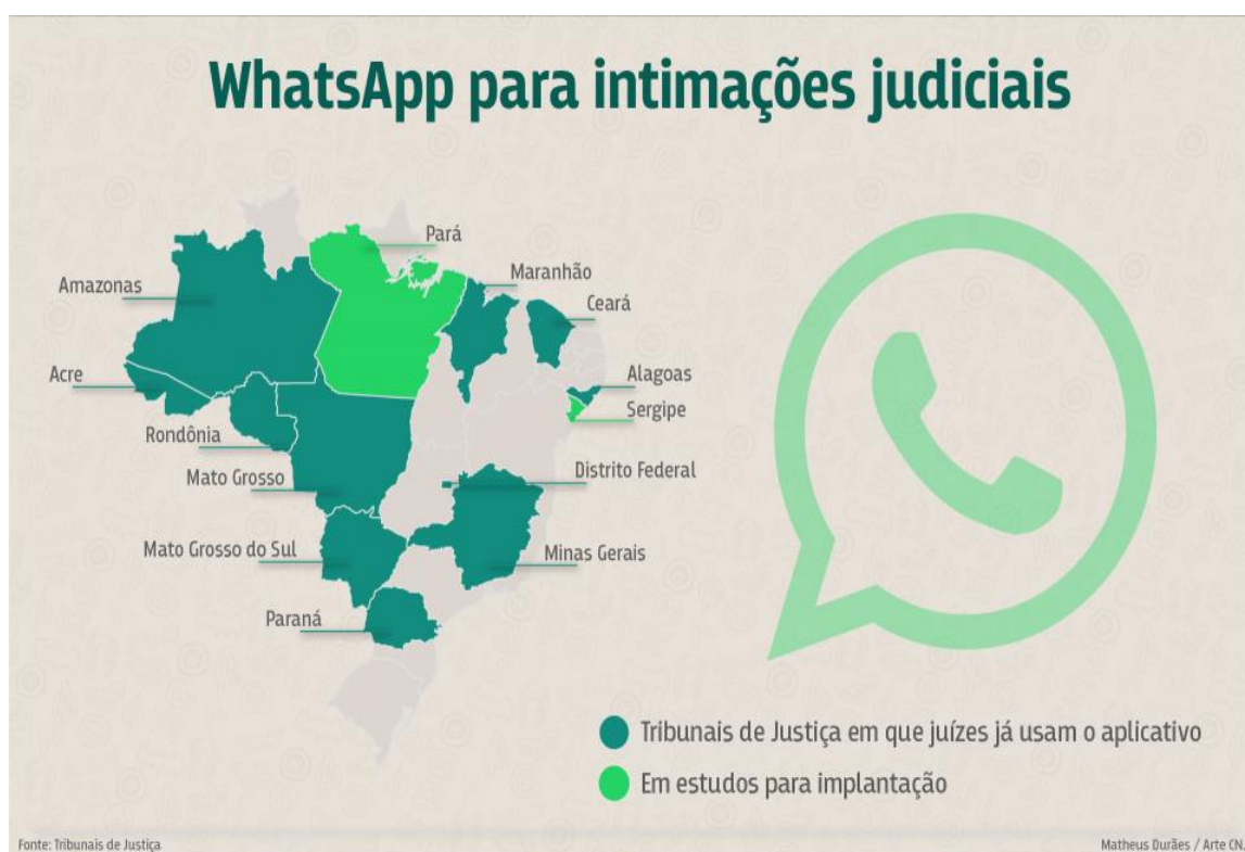
Figura 1 – Uso do aplicativo nos Tribunais do País

O aplicativo WhatsApp , cada dia mais vem ganhando uma notória importância, notadamente como ferramenta para intimações não só nos juizados especiais. Como visto, ele já vem sendo utilizado em algumas varas da família, execução penal, violência doméstica e criminais 33 , segundo pode-se depreender do quadro a seguir: