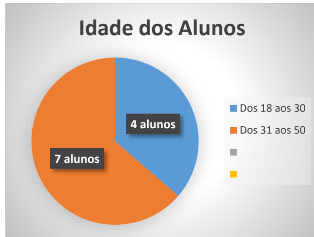
Gráfico 2: Ilustrativo Idade dos alunos entrevistados

Confeccionado por: Camila Pinho Fernandes, 2018.