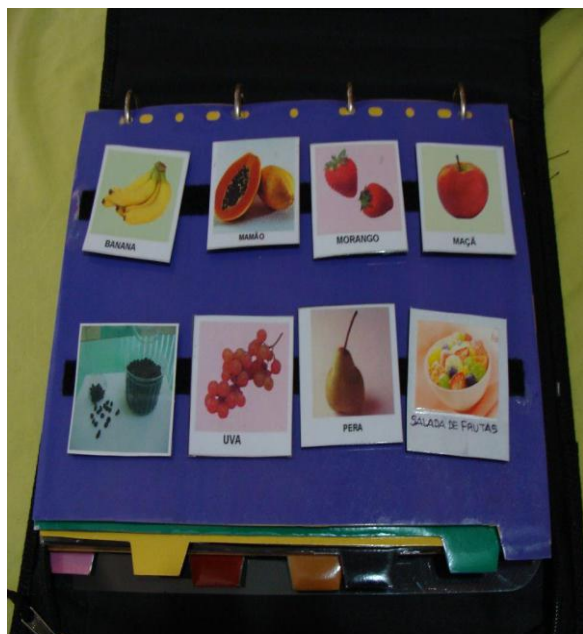
Figura 06: Modelo de Prancha