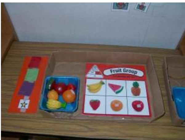
Figura 03: Método TEACCH