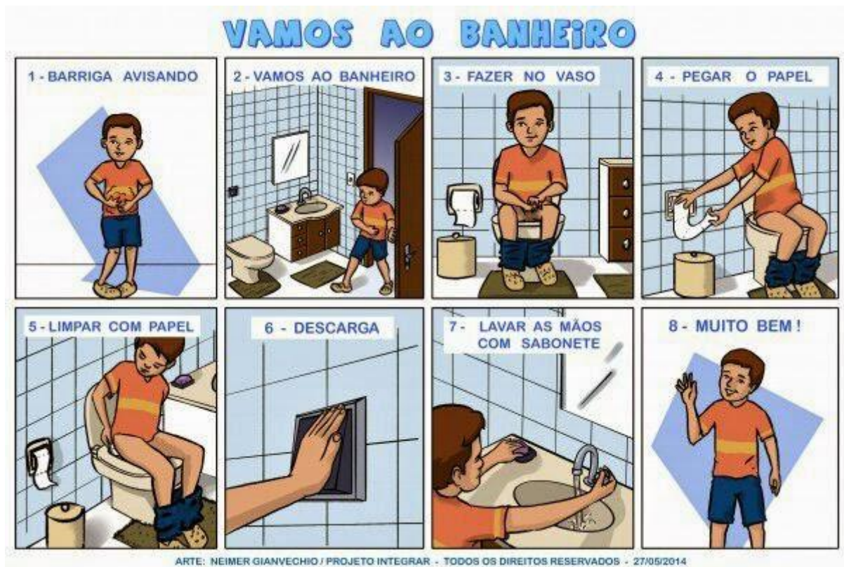
Figura 07: Modelo de seqüências: