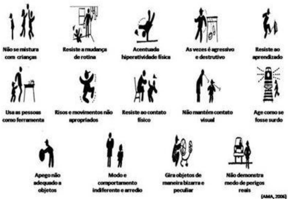
Figura 1: Comportamento autista