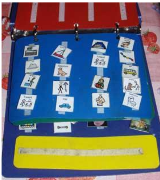
Figura 05: Modelo de Prancha