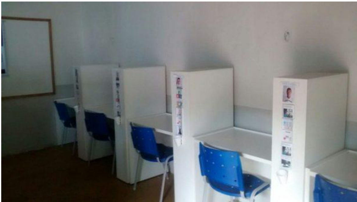
Figura 02: Modelo do ambiente estruturado