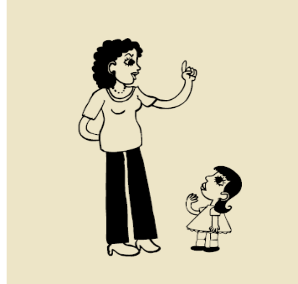
Figura 4 - Olhar de cima, impor ação.