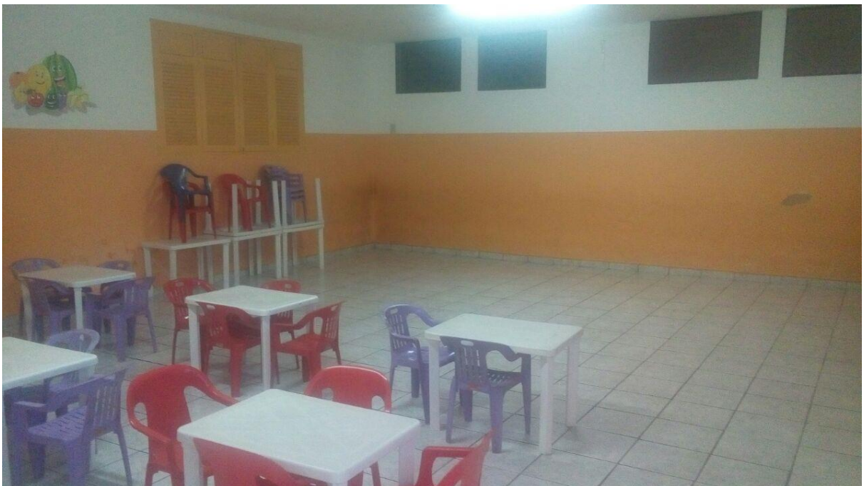
Figura 2 - Refeitório da Creche Municipal Pequena Soraia. Fonte: Arquivo Pessoal. 2016