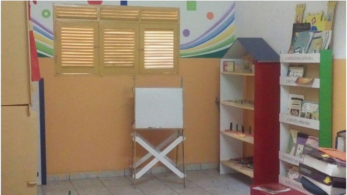
Figura 1 - Brinquedoteca da Creche Municipal Pequena Soraia. Fonte: Arquivo Pessoal. 2016