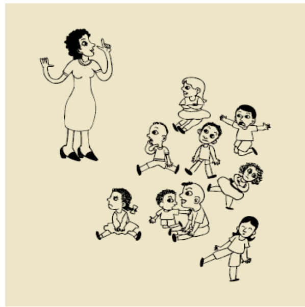
Figura 2- Observar de fora, vigiar o grupo.