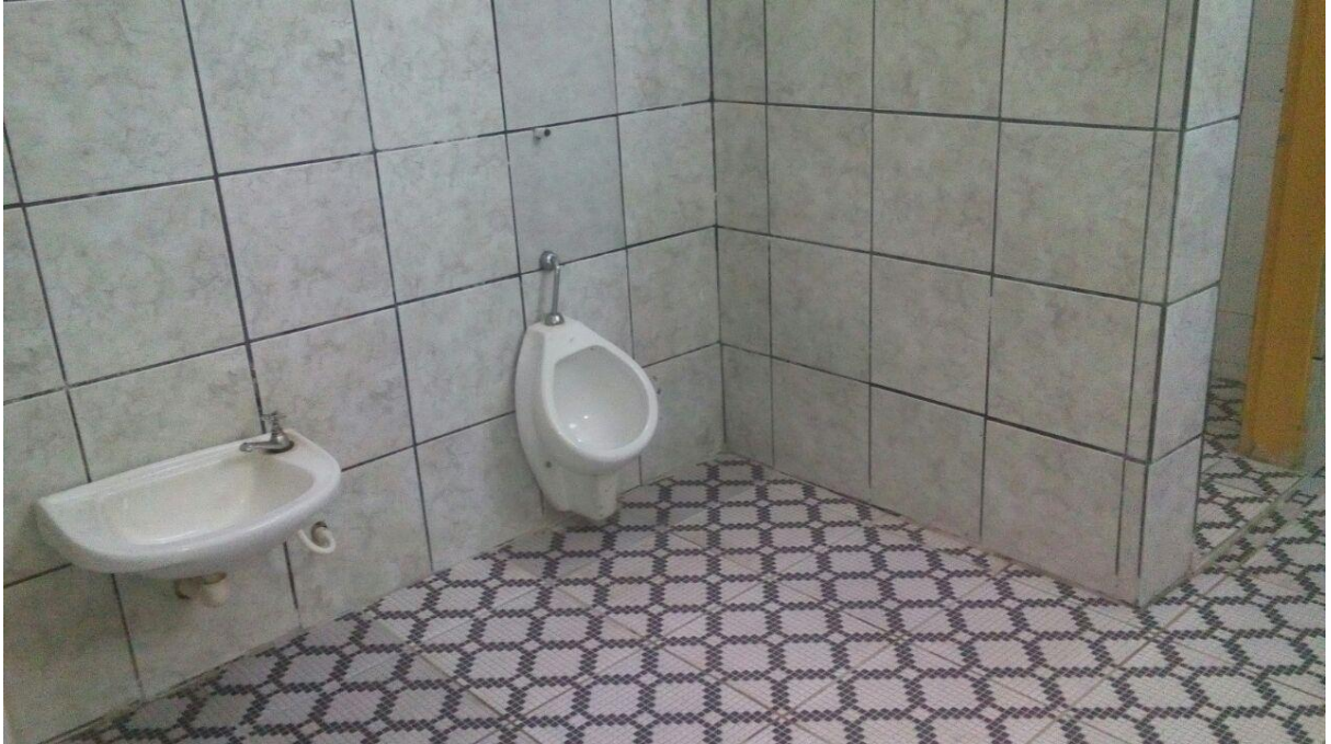
Figura 3 - Banheiro adaptado da Creche Municipal Pequena Soraia. 2016