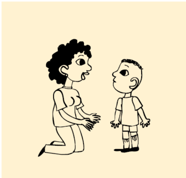
Figura 3 - Envolver com um o olhar, ser parceiro.