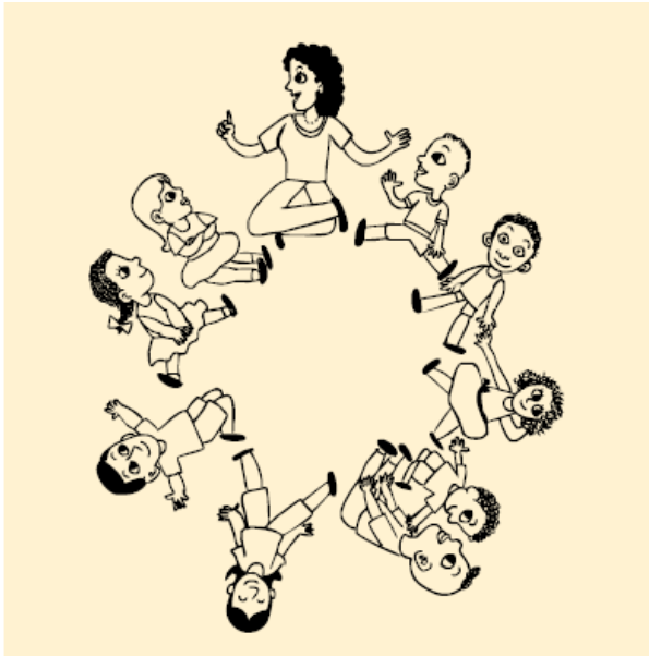
Figura 1- Agregar, estar junto participando com os alunos. Fonte: Adaptada Ministério da Educação (2012).