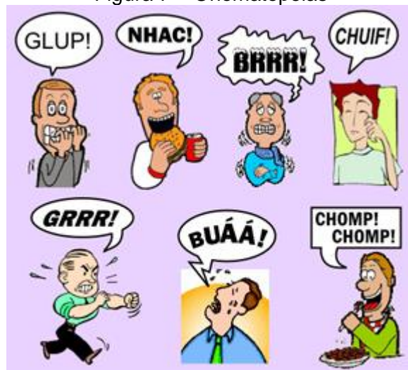
Figura 7 – Onomatopeias