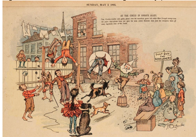
Figura 2 – Tirinha At the Circus in Hogan's Alley (Yellow Kid)