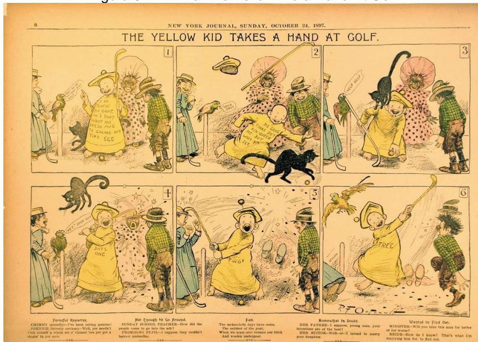
Figura 3 – Tirinha The Yellow Kid a Hand At Golf