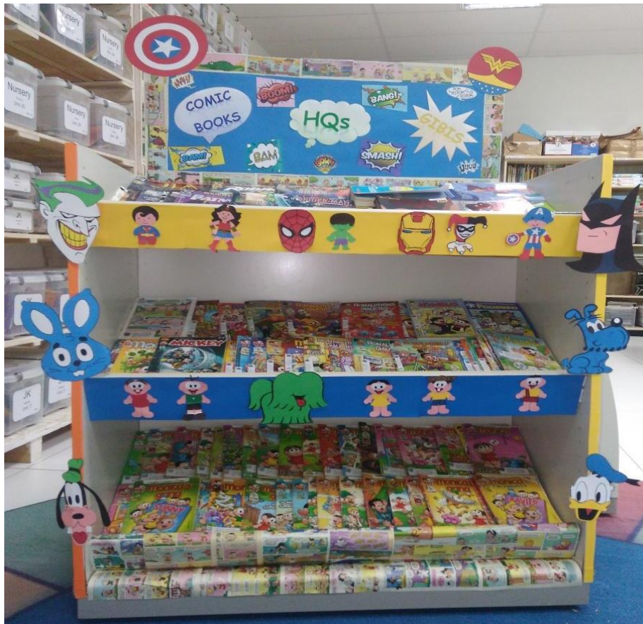
Figura 10 – Estante temática de setembro: Histórias em quadrinhos.

A estante das HQ's foi iniciada no dia 01 de setembro, pois é na sexta-feira que os alunos do terceiro ao quinto ano vão à biblioteca escolherem um livro para levar para casa e ler no fim de semana. A reação dos alunos foi surpresa e encanto devido à decoração colorida e ao posicionamento da estante, localizada em frente à entrada da biblioteca.