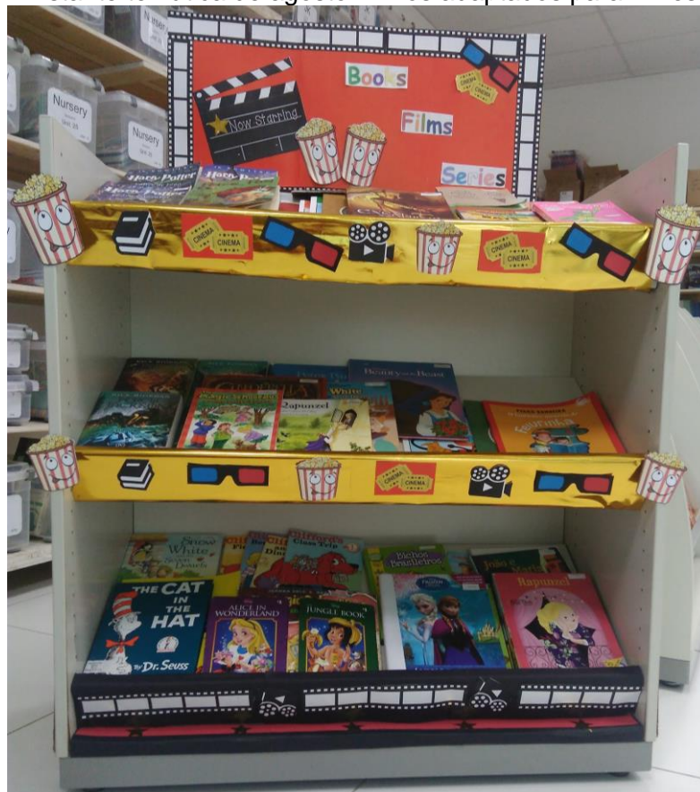
Figura 9 – Estante temática de agosto: Livros adaptados para filmes e séries.

Durante as férias escolares de julho de 2017 foi proposta a ideia de transformar uma estante que estava vazia em uma estante temática onde mudaria o tema todos os meses, o intuito desse projeto é fazer com que os alunos possam conhecer a diversidade do acervo da biblioteca e ampliar suas opções de escolha para empréstimos dos livros. Conforme Campos, Silva e Pinto (2015) ressaltam, que a existência das unidades de informações e seus acervos somente obtêm valor quando utilizados pelos usuários, pois seu motivo de existir é justamente a utilização de seus recursos pelas pessoas. O tema de agosto foi livros que foram adaptados para filmes e séries.