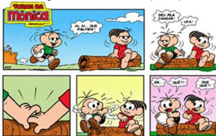
Figura 6 – Turma da Mônica (Balões)