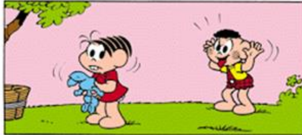
Figura 8 – Método de linguagem pictórico