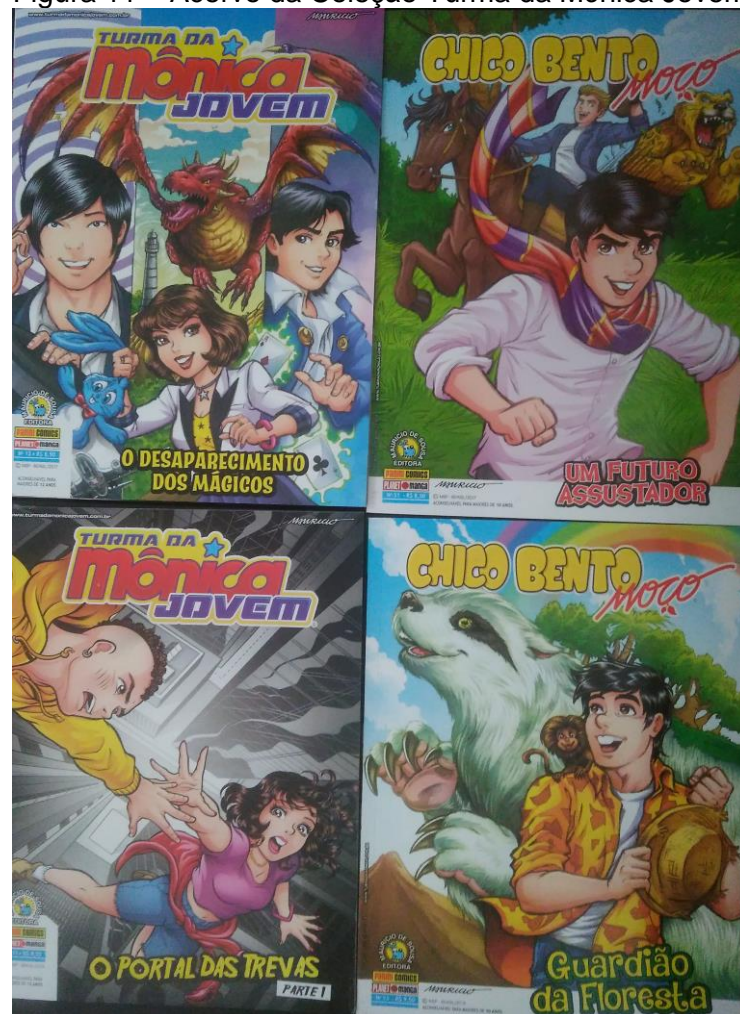
Figura 11 – Acervo da Coleção Turma da Mônica Jovem