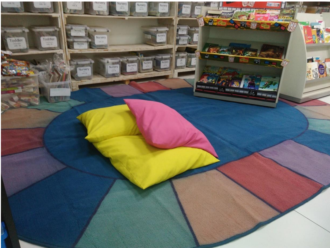
Figura 1 – Área de leitura Biblioteca Maple Bear

físico da biblioteca é climatizado, com carteiras para uso individual e uma área de leitura que pode ser compartilhada, e também utilizada para pelos professores para aulas, contação de histórias e momentos de relaxamento. A decoração da biblioteca é colorida e acolhedora, proporcionando aos alunos conforto e paixão pela leitura e pelo conhecimento.