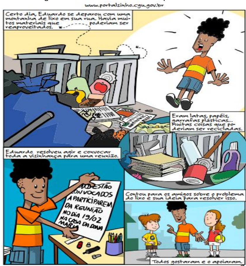
Figura 5 – Turminha CGU em Capitão Cidadão