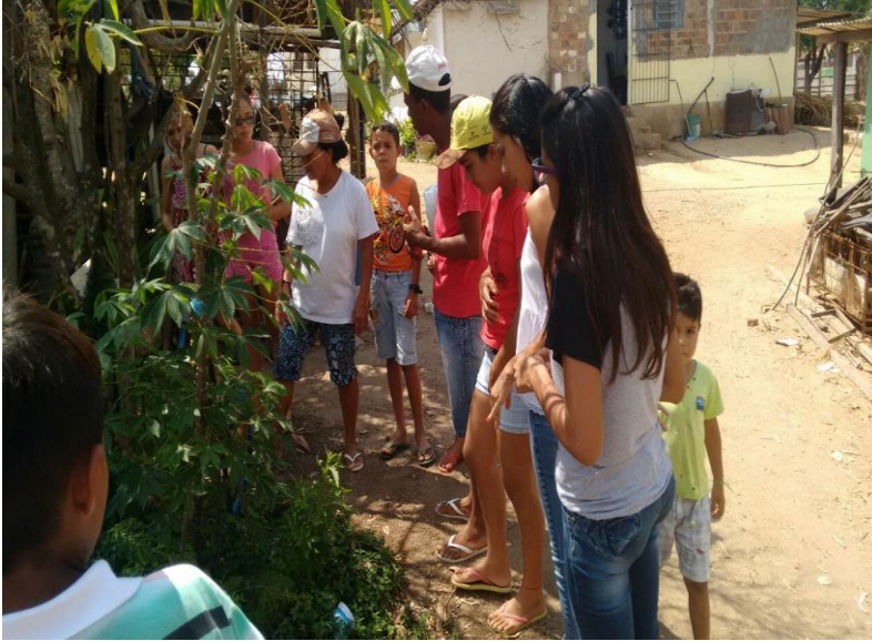
(Figura 11) - Dialogo com uma Assentada;