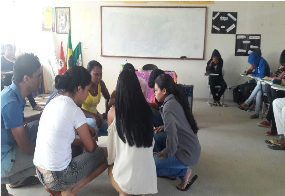
(Figura 2) - Resgate das místicas;