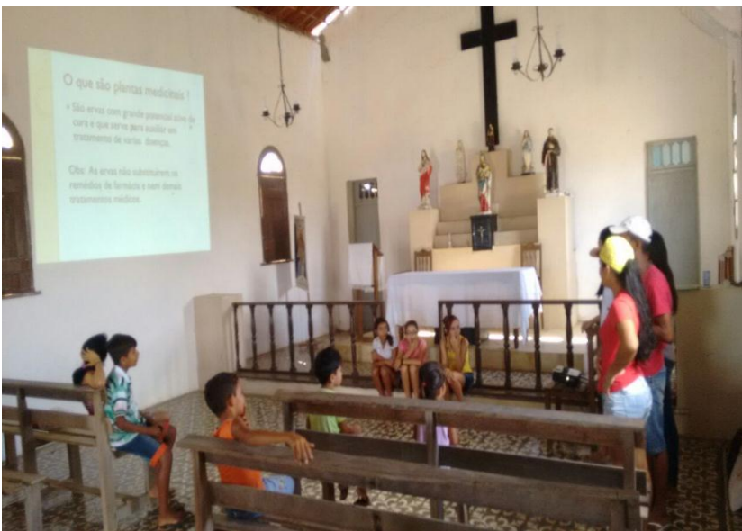
(Figura 10) - Oficina na comunidade Chico Mendes sobre Plantas Medicinais;