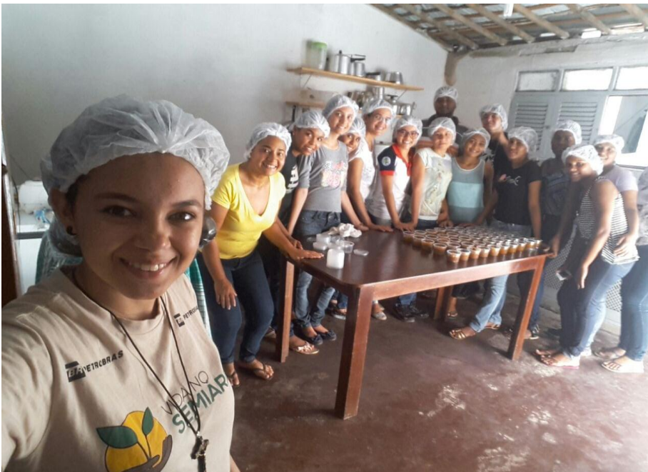
(Figura 6) - Oficina de Produção de geleia ;