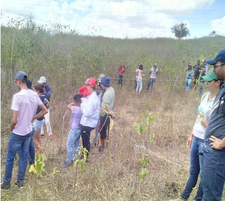
(Figura 9) - Aula de identificação de tipo de solo;