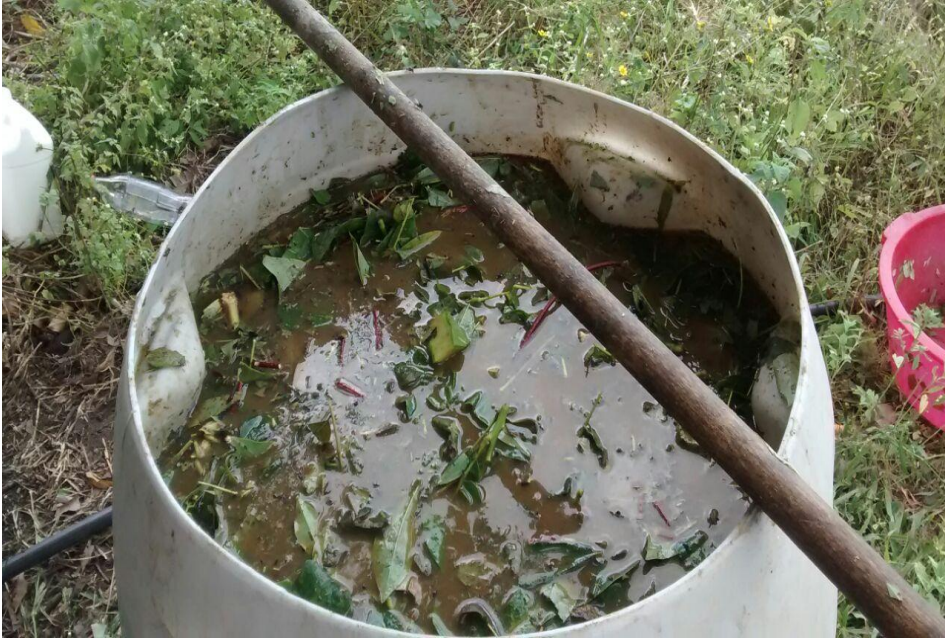
(Figura 5) - Produção de biofertilizante