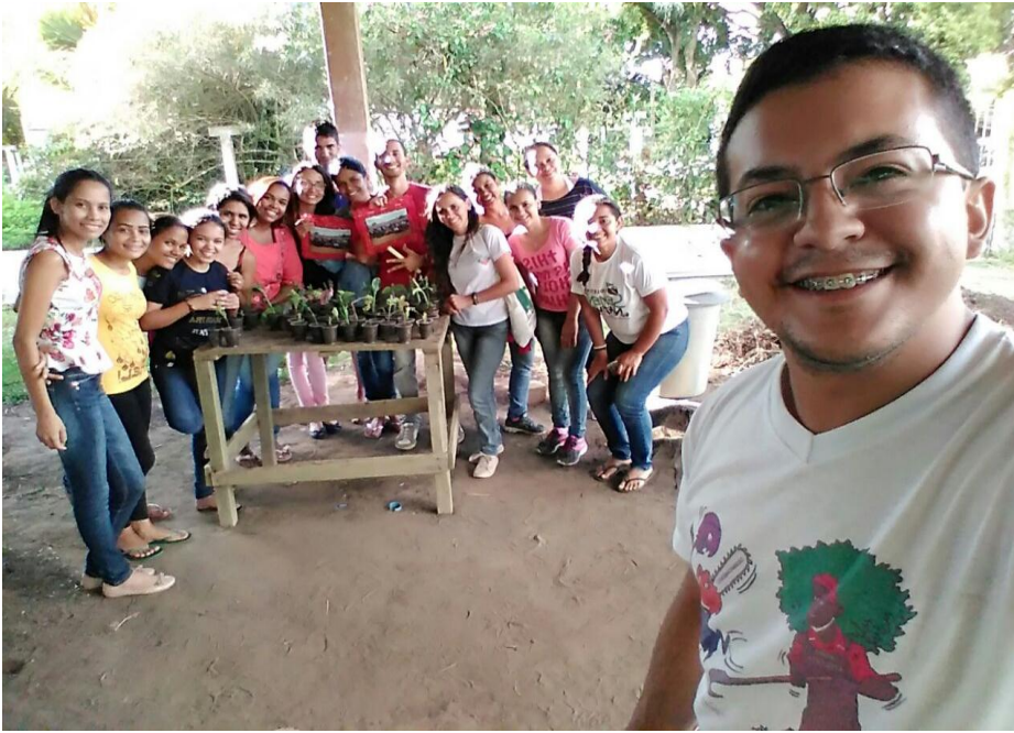
(Figura 7) – Oficina de produção de muda