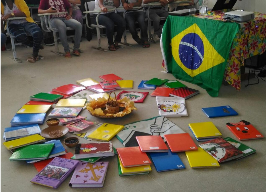
(Figura 1) - Caderno utilizado como diário para contar a história do educando e seus familiares na luta pela terra e a participações na comunidade e sociedade.