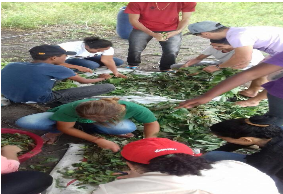
(Figura 4) - Produção de biofertilizante;