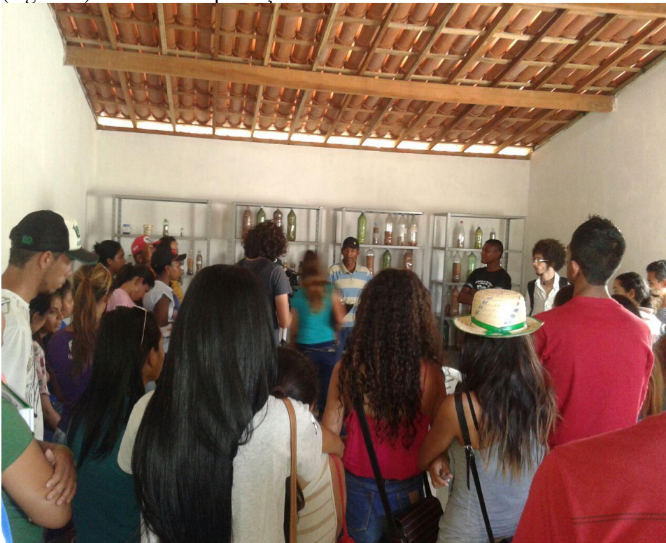
(Figura 8) - Aula de conservação de sementes da Paixão;