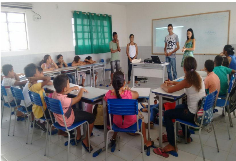
(Figura 12) - Oficina no Assentamento Tiradentes sobre A atuação do jovem e sua comunidade;