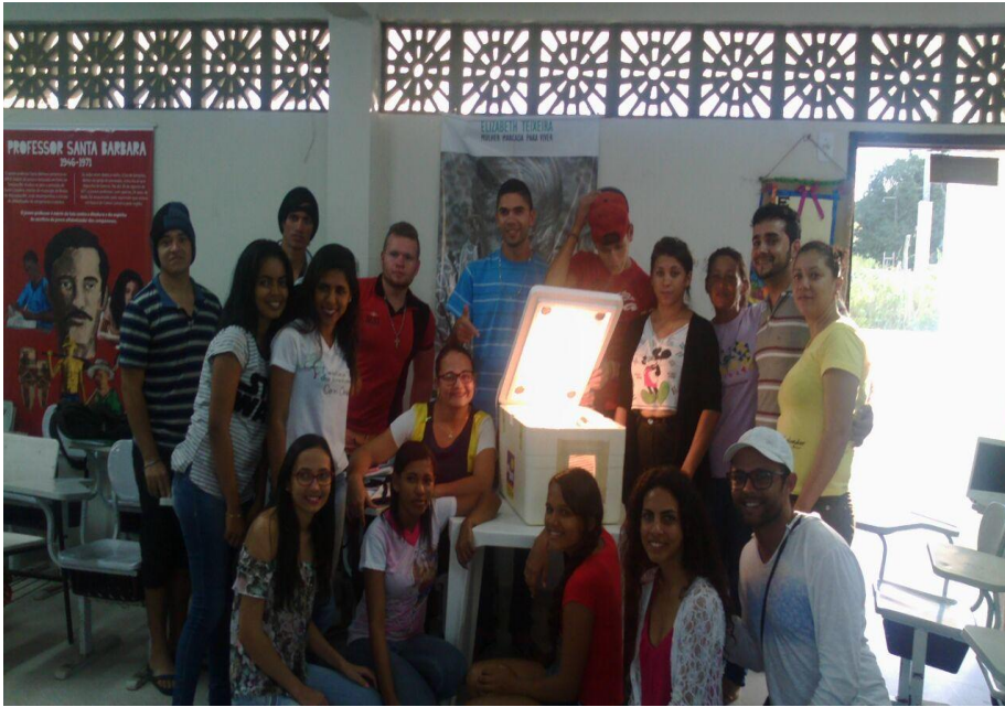
(Figura 3) - Produção de uma incubadora para a criação de aves;