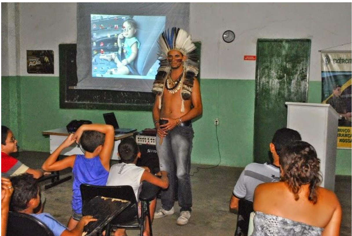
FOTO 1: Professor ministrante da disciplina diferenciada no currículo da escola, a disciplina de tupi.

Reforça-se o aprendizado da língua materna com a oficina de Tupi para os alunos e para a comunidade, através das artes com pinturas corporais e confecções de materiais indígenas, utilizando o Toré, dança tradicionalmente enraizada pela cultura indígena Potiguara.