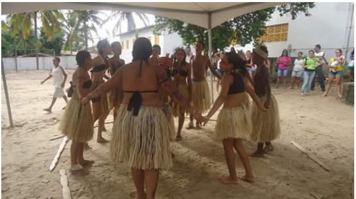
FOTO 2: Prática do Ritual do Toré com os funcionários da Gestão escolar, com os alunos e funcionários da escola, realizado na Escola Indígena Guilherme da Silveira.

Durante minha estadia na Escola Estadual Indígena Guilherme da Silveira, tive o prazer de estar presente em um dos mais representativos aspectos culturais do povo potiguara o ritual do toré. Na fotografia abaixo, podemos visualizar a participação de alguns alunos neste evento.