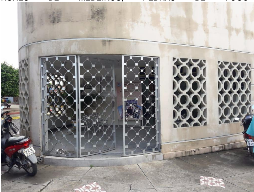
Figura 1 – ESCOLA MUNICIPAL DE ENSINO FUNDAMENTAL I DULCINETE NUNES DE MEDEIROS, PEDRAS DE FOGO – PB

Fonte: Dados coletados pela pesquisadora no período de maio de 2018.