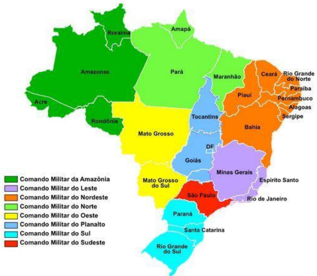
Figura 1 – Divisão de Comando Militares pelo Brasil