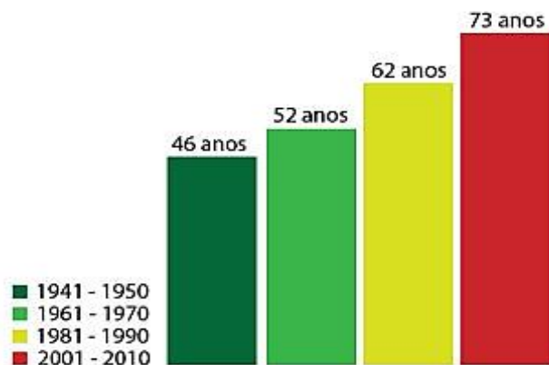
Figura 2 – Expectativa de Vida entre as décadas(2014)

Em 2014, no entanto, a estimativa masculina aumentou mais, com um acréscimo de três meses e 25 dias, contra três meses e 11 dias para as mulheres. Como complemento, a Figura 2 demonstra a evolução da expectativa de vida no Brasil em décadas.