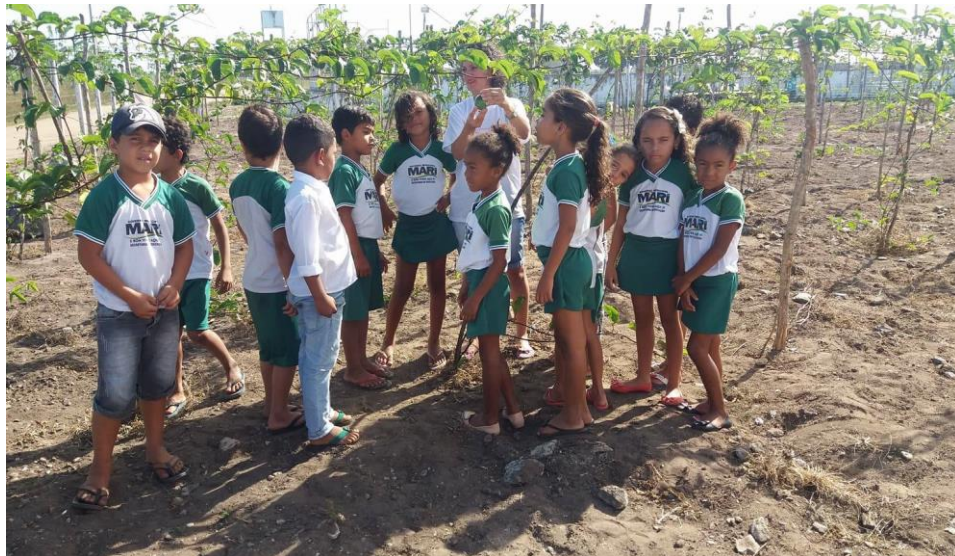
Figura 4 - Aula de campo da educadora com os seus educandos

Nesse sentido, de forma notória se evidencia uma diversidade no que se refere aos níveis de desenvolvimento da aprendizagem, que nos faz refletir a importância em adequar o currículo no contexto escolar, organizando o planejamento a partir da materialização de um conjunto que envolve as relações sócio culturais partindo do campo de vivência, buscando alternativas didáticas como apresentado na figura 04 que desperte através das atividades extracurriculares e da ludicidade o desenvolvimento das diferentes habilidades do sujeito.