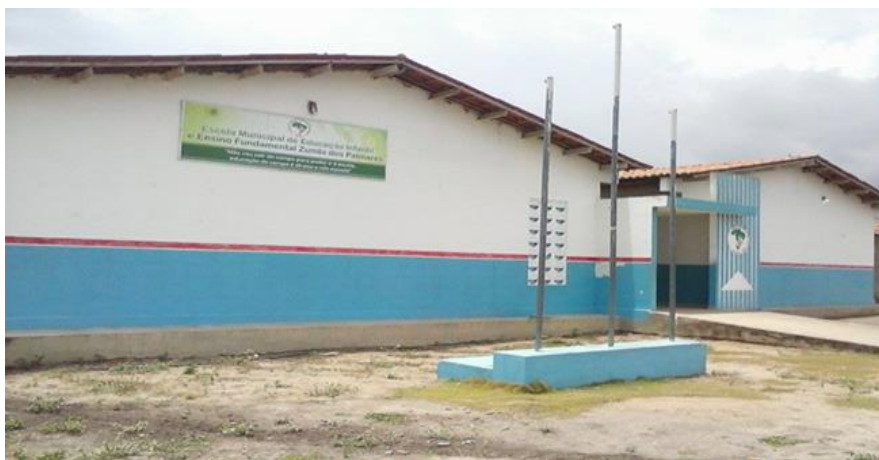
Figura 2 - Prédio atual da Escola