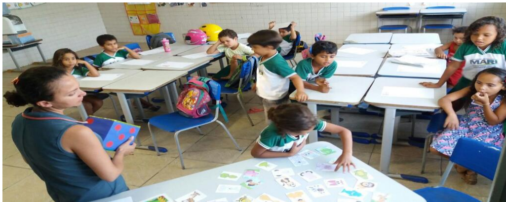
Figura 3 - Atividade lúdica em sala de aula

Para buscar superar essas dificuldades como podemos ver na figura 03, respondendo mais um assunto relacionado ao questionário a professora busca estratégias didáticas para melhorar a metodologia do trabalho na sala de aula construindo uma nova dinâmica a partir de descartar método de aprender por meio da memorização, porquanto introduz em seu planejamento atividades lúdicas, coletivas e extracurriculares com o intuito de alavancar os objetivos pré-estabelecidos.