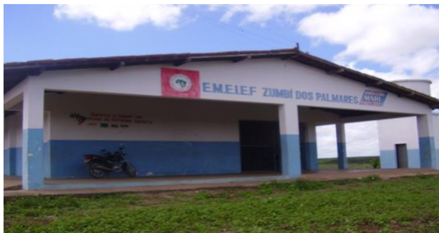
Figura 1 - Prédio antigo adaptado onde funcionava a escola.

Fonte: Arquivos da Formação Continuada. UFPB, 2007