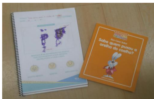
IMAGEM 3 - Apostila

Os livros que já tinham sido utilizados na contação de histórias eram apresentados novamente para as crianças numa cesta sempre na sexta-feira na biblioteca. Em casa os pais teriam que recontar a história e posteriormente, a criança precisava responder se gostou da história e desenhar a parte da história de que mais gostou e, com a colaboração da família, escrever o título, os pais eram responsáveis por facilitar a interpretação em casa, mas a criança deveria comunicar oralmente o que entendeu da história.