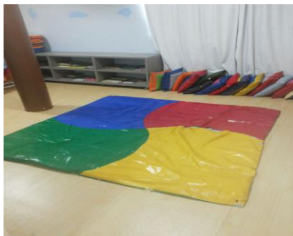
IMAGEM 1 – Centro de convivência

Para contação de histórias vários espaços foram utilizados como: brinquedoteca, parque e quadra, isso variava de acordo com o tipo de literatura a ser utilizada, buscávamos sempre aproximar o espaço físico, segundo os textos e ilustrações de cada obra. O planejamento do espaço ou até adaptação, segundo a necessidade da criança e o contexto da obra a ser lida sempre foi importante para execução. Em alguns momentos utilizávamos o centro de vivência exposto logo abaixo, por se tratar de um local aconchegante, colorido, com estante acessível para as crianças com várias almofadas, nesse espaço elas sentiam-se a vontade para ouvir e interagir com todos.