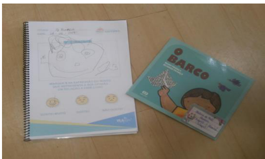
IMAGEM 2 - Apostila

Os pais tinham uma semana para realizar a atividade juntamente com a criança no ambiente familiar. Na sexta-feira as crianças eram convidadas a escolher um dos livros utilizados no projeto, que serviria de apoio à produção em casa. Os pais também eram orientados previamente sobre a participação deles no projeto. Logo abaixo segue duas imagens de apostilas que tiveram as atividades de interpretação, que foram realizadas com a colaboração dos pais.