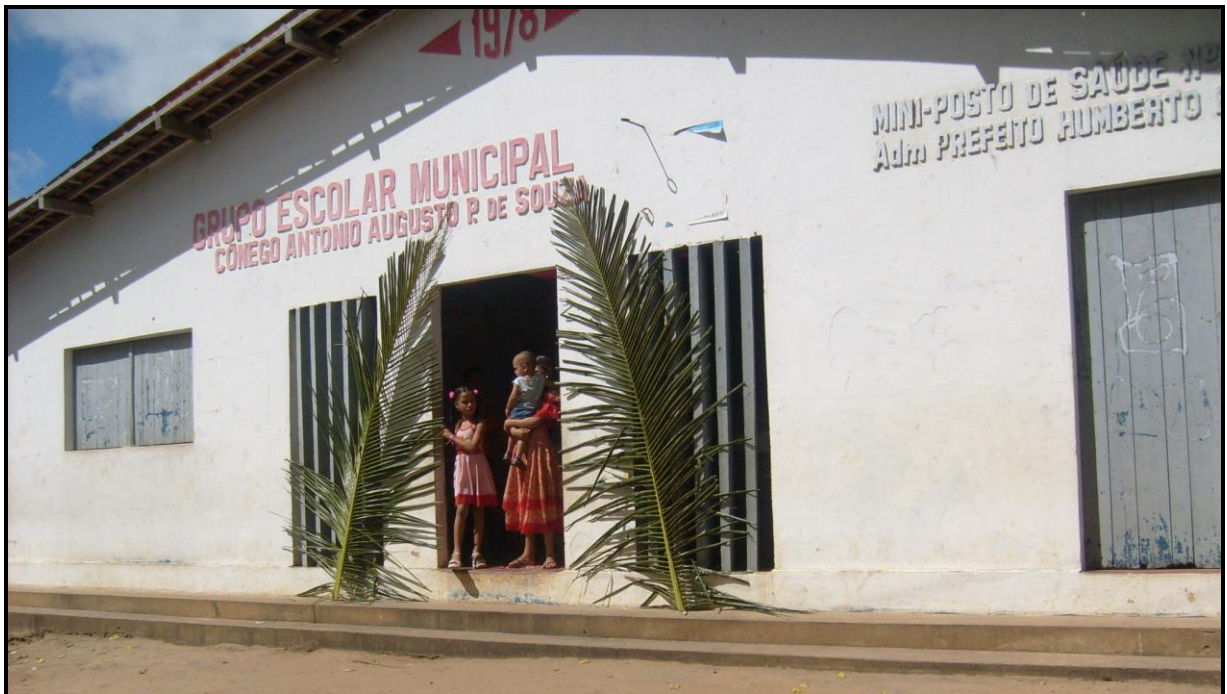
Figura 10 – Foto da Escola da Comunidade Curral Grande, construída em 1978.