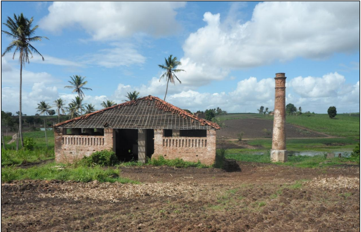
Figura 7 – Foto do Engenho Curral Grande, desativado.