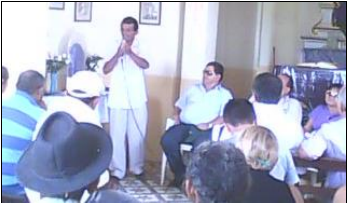
Figura 8 – Foto da Reunião na Igreja Santo Antônio para tratar dos problemas das assinaturas