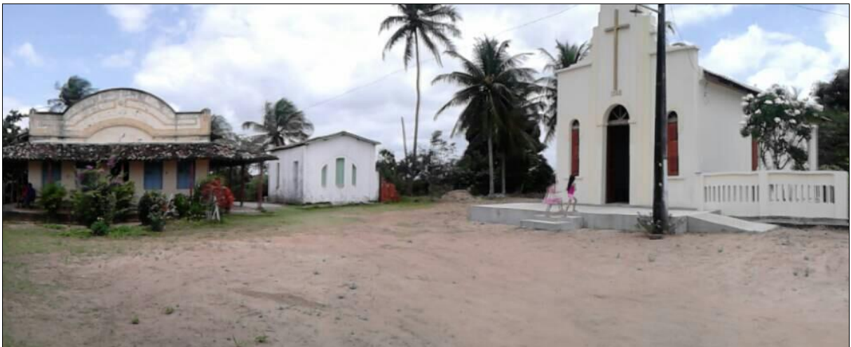
Figura 3 - Foto da Sede da Fazenda Curral Grande