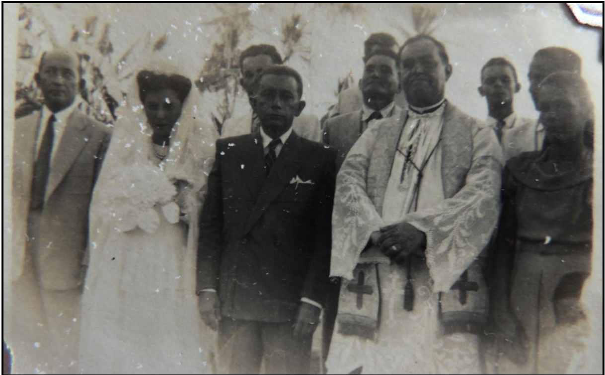
Figura 4 – Foto de Celebração de casamento realizado pelo padre Antônio Madruga