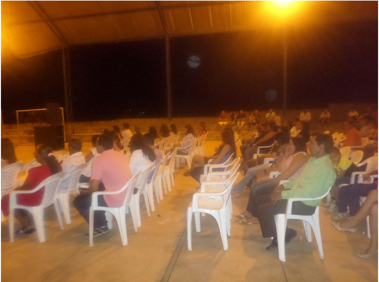
Figura 5- Foto do Evento evangélico realizado na quadra