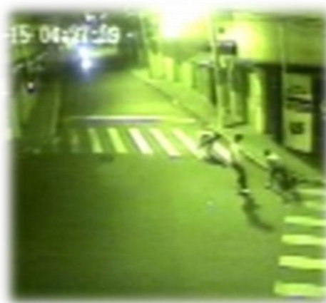
Figura 37: Esse vídeo mostra a imagem de um travesti sendo espancado por um grupo de rapazes. Vídeo exibido no programa Fantástico da Rede Globo, acesso em janeiro de 2012. http://www.revistanordeste.com.br/noticias/paraiba