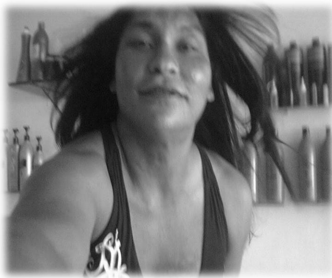
Figura 8: “Cabelo ao vento”, um efeito com um ventilador ligado. Acesso em junho de 2011

http://www.orkut.com.br/Main#Album?uid=6707444842198796911&aid=1335474505