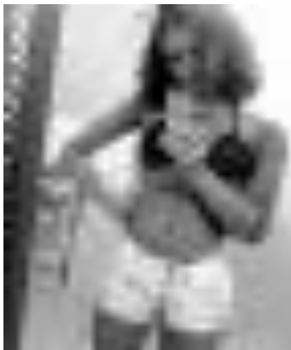
Figura 33- essa fotos não saiu nítida, pois eu não tive acesso, por não exibir as minhas. Nas fotos postadas, geralmente, elas procuram mostrar o corpo e o rosto. Fazendo poses em pé ou deitadas. Acesso em dezembro de 2011- http://us1.badoo.com/01178903441/?r=41&p=2

E por partilharem, em alguns casos, “algo em comum”, muitas pessoas marcam encontram, que é rápido, pois ao clicar em “Pessoas por Perto” abre uma possibilidade de encontrar pessoas de até mesmo da mesma cidade ou bairro. Alguns julgam que esse site, serve apenas para marcar encontros casuais, ou seja, as mulheres são garotas de programas e se tiver travesti também. Mas na realidade em alguns relatos de algumas travestis, informam ao contrário: