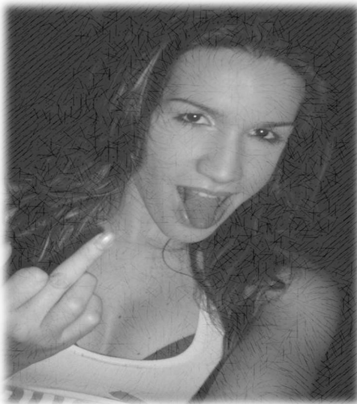
Figura 11 - Na legenda dessa foto, onde a travesti com uma blusa decotada com a língua de fora e fazendo um gesto obsceno, está escrito: “ Achando ruim? Toma no c... ” Um insulto para uma pessoa anônima... E recebe como resposta o seguinte comentário: “ Ah... essa língua eu quero! Delícia ”. Acesso em junho de 2011: http://www.orkut.com.br/Main#Album?uid=15203471325149907137&aid=1233227870