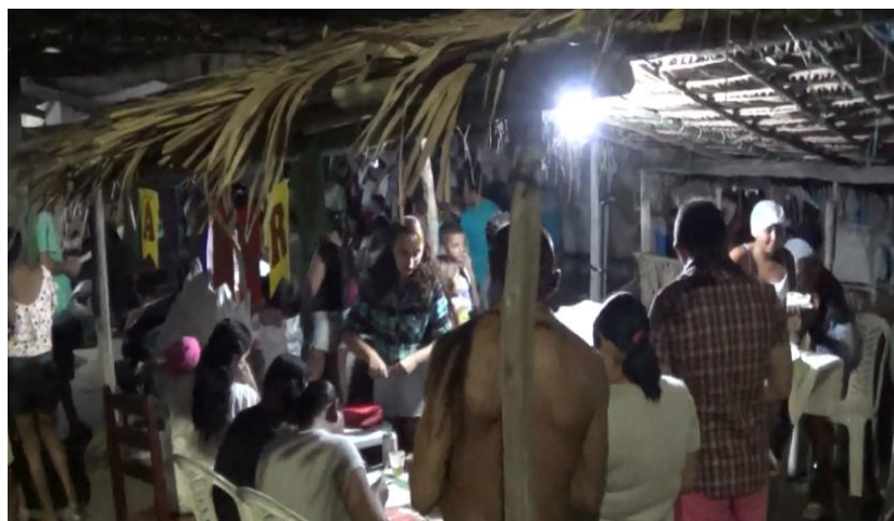
Figura 12 Barraca do São Pedro

Como posto anteriormente na p. 47 deste trabalho, as festividades do São Pedro iniciam dia 20 de junho com a abertura dos novenários, este é o dia que a comunidade de Barra está atuante para comercializar comidas típicas a bebidas e o consumidor e o comerciante se socializam por vínculos de interesse próprio. Visto que, durante os noitários uma barraca (fig. 12) é montada exclusivamente para arrecadar dinheiro para a manutenção da igreja, em material de higiene, limpeza e alguns outros que venham surgir. Todo o dinheiro é colocado em caixa para futuras necessidades, esses lanches são vendidos desde a abertura das festividades até o seu encerramento na véspera de São Pedro.