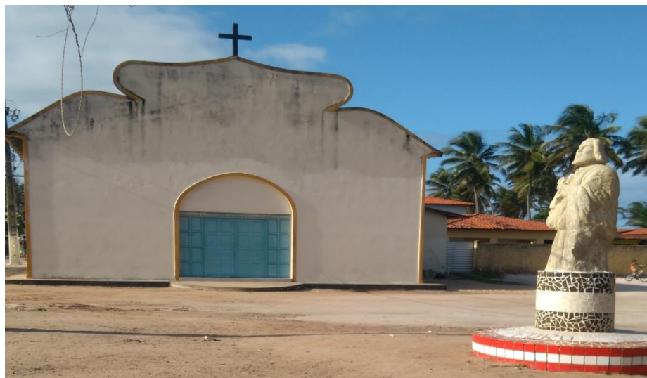
Figura 8 Igreja Católica da Barra.