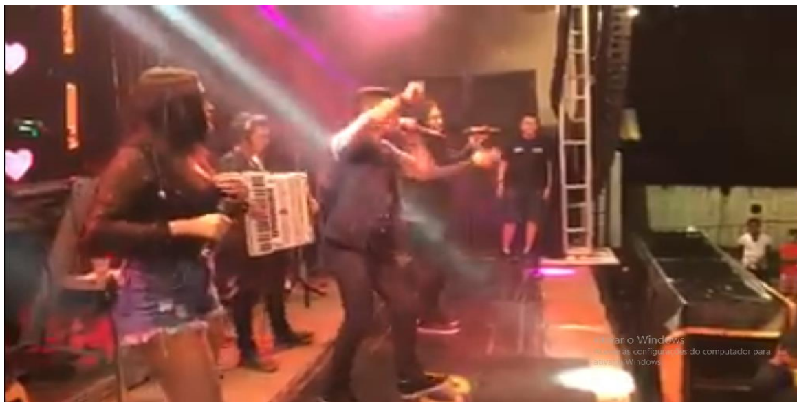
Figura 16 Bonde do Brasil

até a igreja local, o pessoal reza e alguns voltam para a aldeia e outros ficam para a festa com o forró estilizado (fig. 16) que rende até 4:00 ou 5:00 horas da manhã do dia 29.