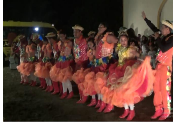
Figura 14 Quadrilha Asas Dourada