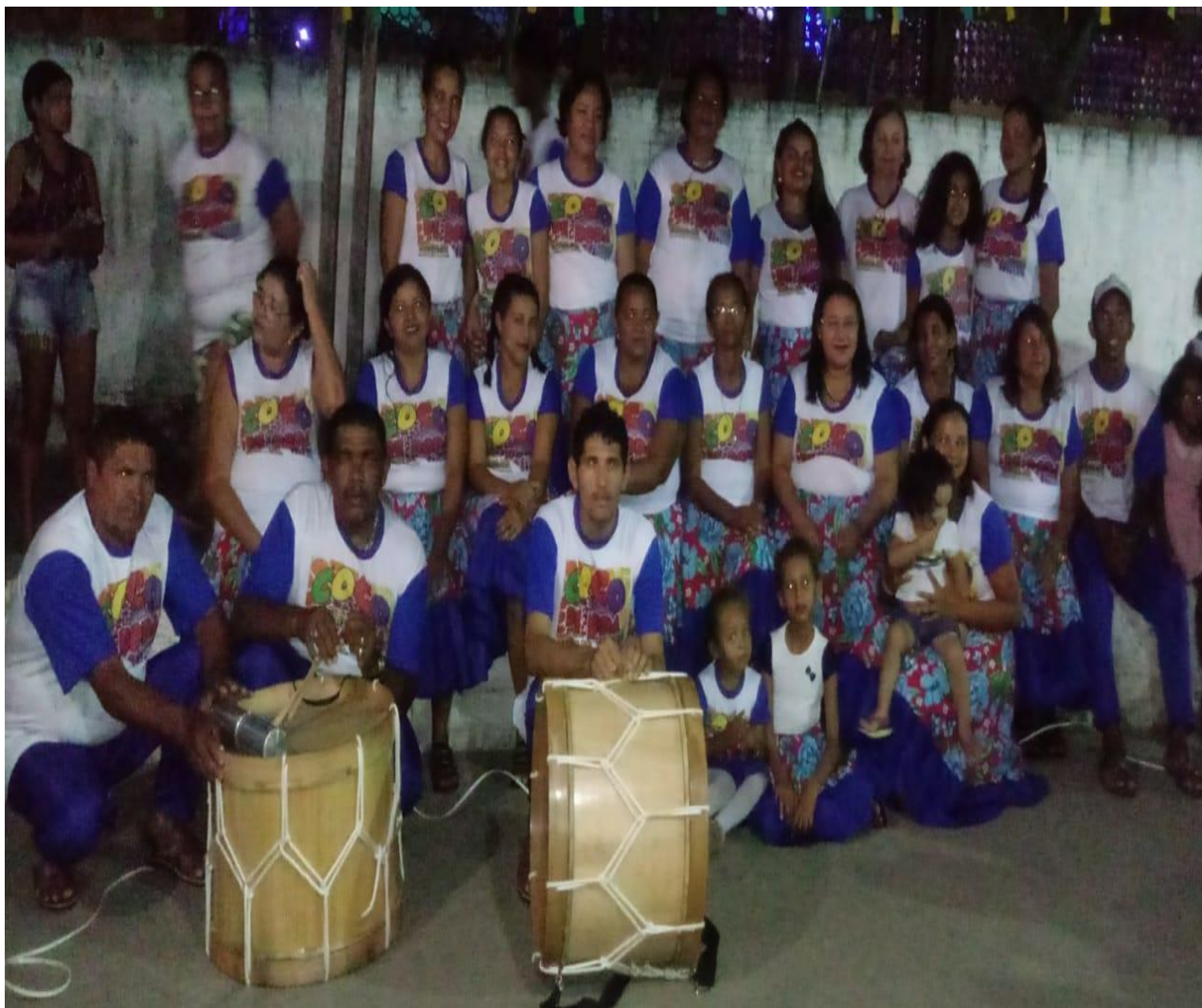
Figura7 Grupo do coco de roda da Barra.

Tanto a dança do coco quanto a festa de São Pedro sofreram mudanças por causa da conversão de várias pessoas às igrejas evangélicas. Em Barra do Camaratuba, no que se refere às conversões, a tradição da festa de São Pedro não sofreu modificações, pois a maioria dos evangélicos não são nascidos no local, ou seja, são pessoas que se estabeleceram na comunidade e também não tiveram desempenho significativo na igreja católica. Na aldeia Cumaru, ao contrário, os evangélicos em sua maioria são nativos da comunidade, e outrora também foram católicos ativos na organização da festa.