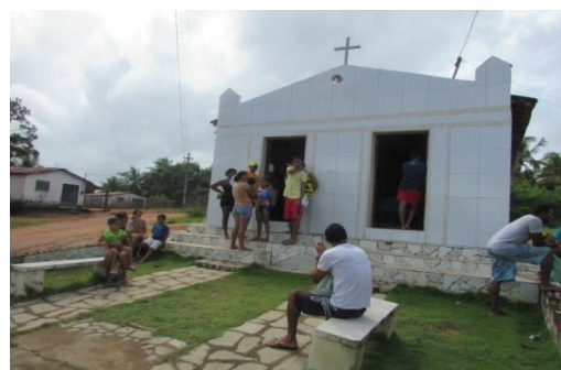
Figura 20 Igreja São José do Cumarú.