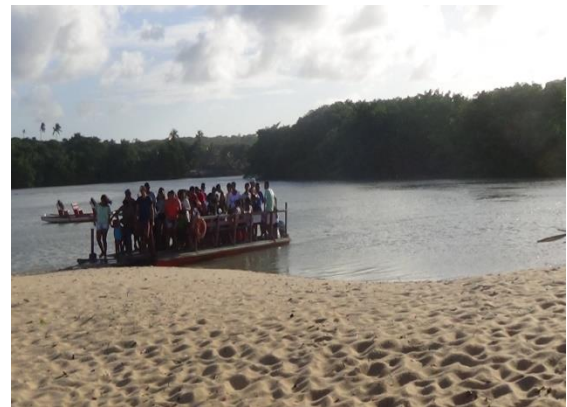
Figura 5 Travessia Volta