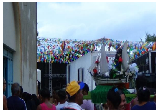
Figura 22 Chegada da imagem na Barra.

Após a chegada da imagem na igreja em Barra do Camaratuba (fig. 21) as duas comunidades celebraram um terço e concluíram com “a paz” este ato consiste em saudar o “irmão” com abraço ou aperto de mão. Assim o pessoal do Cumaru retornou para suas casas e não participaram da festa que estava marcada para iniciar as 22:00 horas.