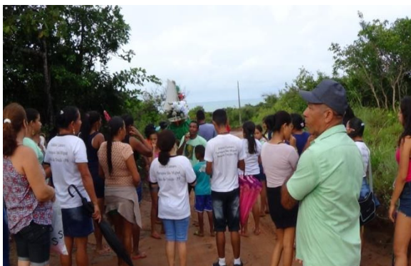
Figura 21 Procissão do Cumaru.