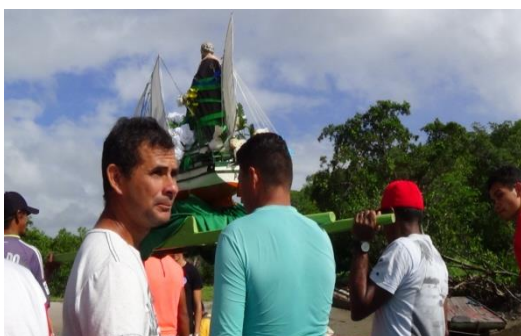
Figura 19 Ida para o Cumarú.

movidos a motor também fez o mesmo percurso, este fez apenas uma viagem, após o desembarque dos fieis do lado sul do rio e com todos reunidos a procissão segue por um caminho de barro e areia até a igreja de São José na aldeia Cumarú (fig. 7). Importante ressaltar que no meio do caminho encontramos pessoas vindas do Cumarú que vinham encontrar com a procissão (falo “encontramos” por que estive presente na procissão junto com Maria Elita 28 e os devotos do santo) totalizando um percurso entre a igreja da Barra e a igreja de São José no Cumarú um percurso de 4 km.