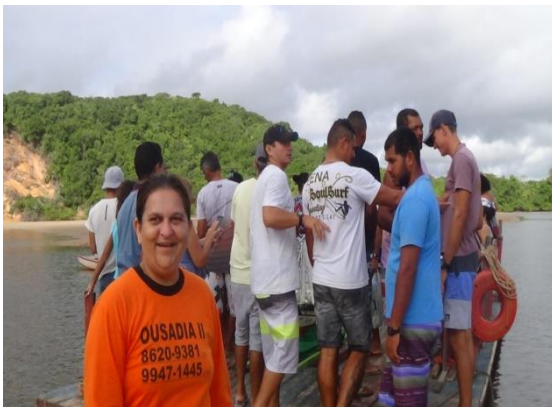
Figura 4 Travessia Ida