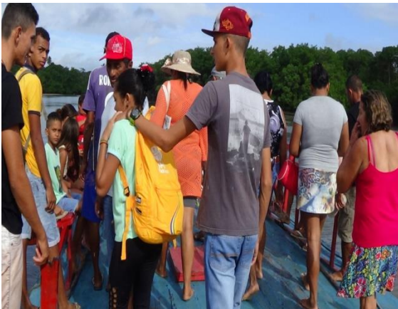
Figura 2 Travessia ida

Essas afinidades entre as comunidades estão presentes no artesanato, no lazer na Boca da Barra, no trabalho nas empresas e nas pousadas. O coco, o rio e a relação de parentesco entre os moradores das duas comunidades são fatores que contribuem para o estabelecimento de um relacionamento social comunitário. (Bacalhão, 2006, p. 13)