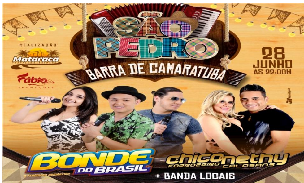
Figura 17 Cartaz da festa de São Pedro

apareceu nas apresentações “ locais ”, a saber, uso locais entre parêntese porque 2017 como primeiro ano da minha pesquisa nenhuma apresentação era da comunidade de Barra, as atrações de quadrilha, forró pé de serra e outras eram da cidade de Mataraca ou até mesmo de outros estados. Para receber maior público de turista a prefeitura se encarrega de divulgar a festa de São Pedro e suas atrações (fig. 6).