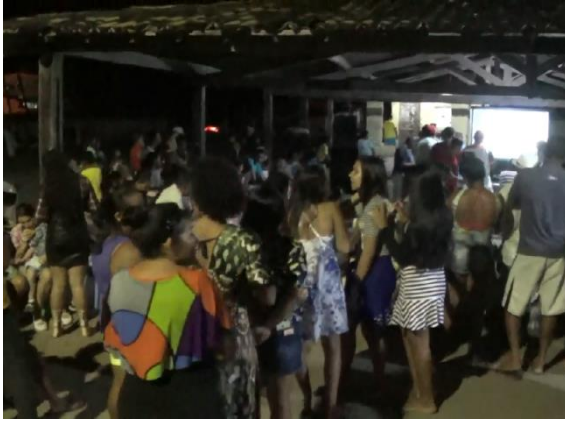
Figura 13 Bingo