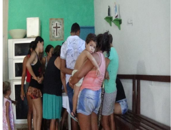
Figura 11 Término da reunião.

Como posto anteriormente na p. 47 deste trabalho, as festividades do São Pedro iniciam dia 20 de junho com a abertura dos novenários, este é o dia que a comunidade de Barra está atuante para comercializar comidas típicas a bebidas e o consumidor e o comerciante se socializam por vínculos de interesse próprio. Visto que, durante os noitários uma barraca (fig. 12) é montada exclusivamente para arrecadar dinheiro para a manutenção da igreja, em material de higiene, limpeza e alguns outros que venham surgir. Todo o dinheiro é colocado em caixa para futuras necessidades, esses lanches são vendidos desde a abertura das festividades até o seu encerramento na véspera de São Pedro.