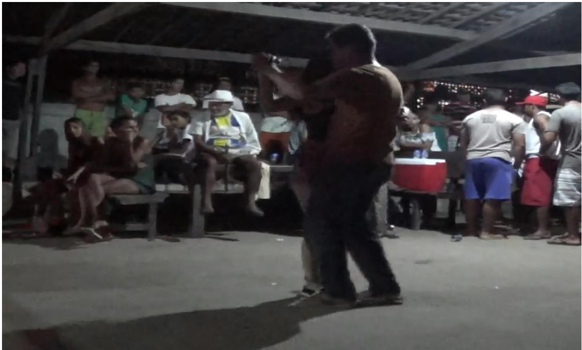
Figura 15 Forró pé de serra

Após as apresentações do dia 23 as programações seguiram com as novenas até o dia 28 como já citado. No dia 24 pela manhã é a travessia da imagem 24 para a aldeia Cumaru, este momento conta com uma parte da população de Barra para ir à procissão até o Cumaru. Mesmo com a imagem estando na aldeia, a programação das novenas de São Pedro continua acontecendo na comunidade de Barra. No dia 28 a aldeia Cumaru trás o santo em procissão