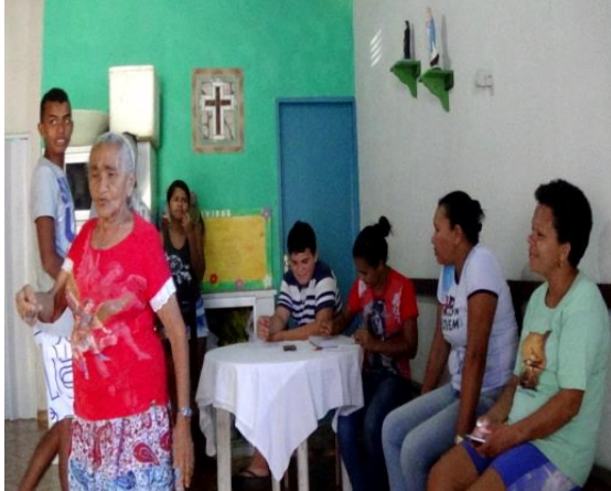
Figura 10 Início da reunião.