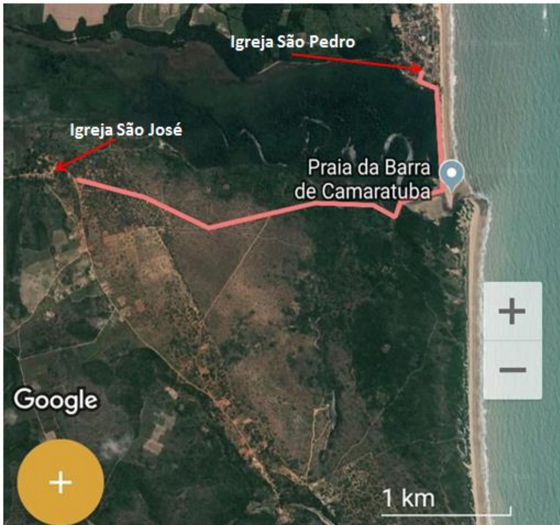
Figura 18 Percurso de Barra a Cumaru