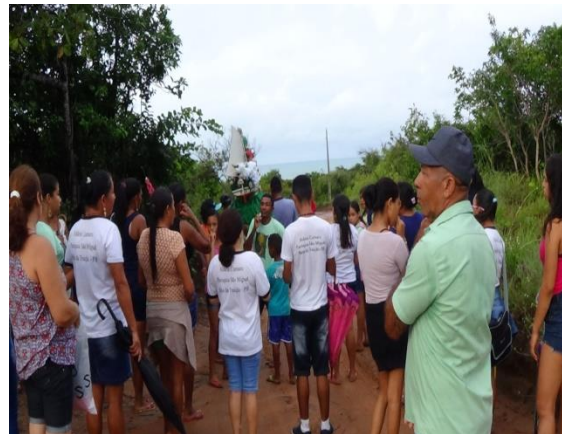
Figura 3 Travessia volta