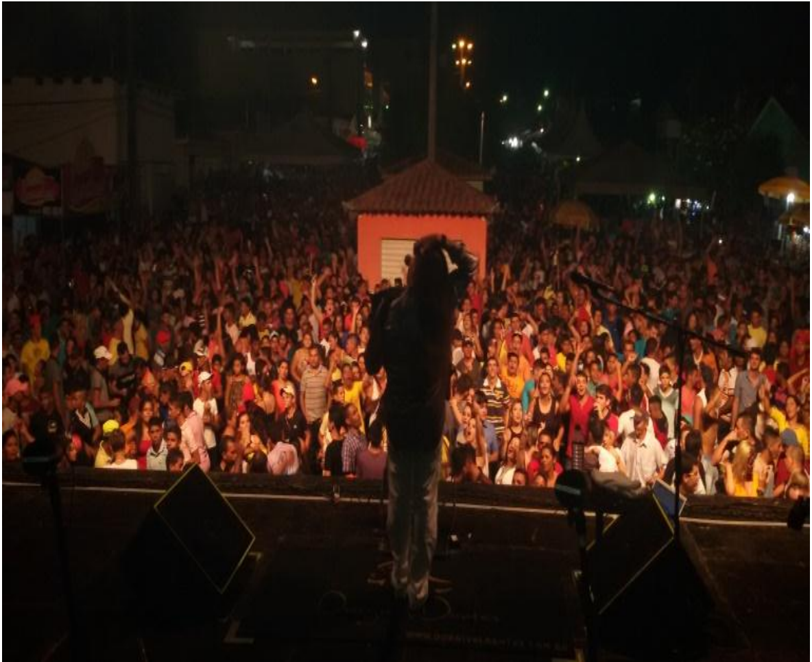
Figura 4 –1º noite da Festa de Santos Reis

Para o prefeito da cidade de Itapororoca os vereadores e todas os políticos que o acompanharam na Festa de Reis, a festa é uma oportunidade de diversão, mas também é um momento para eles fazerem política, através da disseminação de “seus nomes” nas campanhas futuras. Durante a realização da festa os políticos locais costumam se reunir em diferentes espaços para acolher o povo presente, assim fazendo parceria com diversas autoridades.