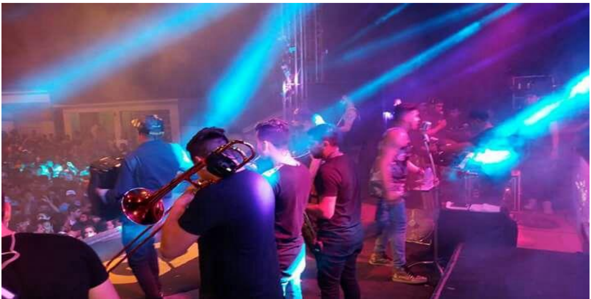
Figura 6 –1º noite da Festa de Santos Reis

No ano de 2017, a festa de Santos Reis voltou a acontecer em dois dias, com a nova Gestão Municipal, a transformação aconteceu somente na parte profana. Esse ano as principais bandas foram Aduílio Mendes e Gabriel Diniz, além das Bandas Forró do Bixão e Pegada Sacana. A festa teve aproximadamente 5 mil pessoas participando.