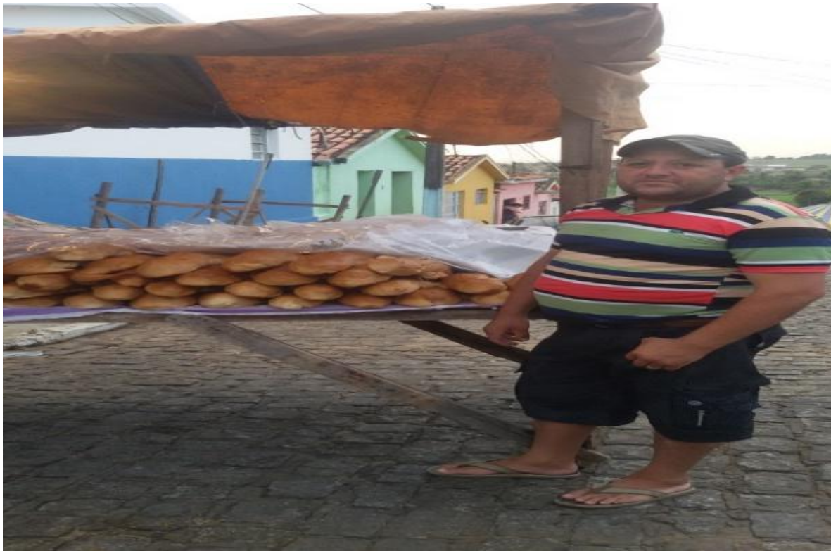
Figura 3 – Ambulante vendido os pães

A partir da década de 1990, a festa já possuía uma estrutura maior, pois as autoridades resolveram além de proporcionar ao público os artistas da terra, bandas de outros estados e municípios, precisando de um palco maior, por causa da sonorização das bandas. O estilo musical apresentado sempre foi o forró, por ser algo cultural da região e a festa sempre foi realizada nos dias 05 e 06 de janeiro. Referente ao local onde acontecia os festejos profanos como eram em frente à igreja matriz, os políticos da época resolveram colocar um piso mais adequado, dando mais conforto e estabilidades aos participantes.