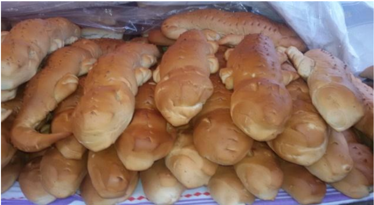
Figura 2 –Pães franceses vendidos pelos ambulantes.

Quem comprava os pães, em sua grande maioria, que são vendidos pelos ambulantes da cidade de Itapororoca, eram as senhoras de idade. Um vendedor chamado Adriano residente no sítio “Barroca dos Santos”, município de Itapororoca, conta que algumas moças até hoje compram o pão e fazem um pedido pra Santo Antônio, para lhes mostrar um bom casamento.