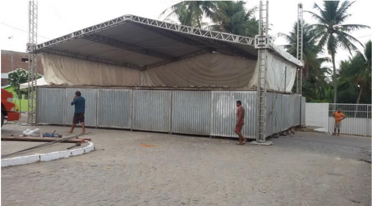
Figura 6 –Montagem do palco

Na festa de Santos Reis realizada na cidade de Itapororoca existem muitos pontos positivos, como por exemplo: ela serve como entretenimento para muitos moradores, gera renda para os comerciantes e ambulantes, proporciona o encontro entre amigos e familiares, constrói experiências de Lazer, Sociabilidade, Religiosidade, etc. Enfim, essa festa representa um momento de grande diversão, tanto na parte profana como na religiosa - movida pelos shows gospel que acontece apenas em um dia, que trata-se de apresentações de cantores evangélicos ou católicos que cantam em média três horas em frente à igreja matriz.