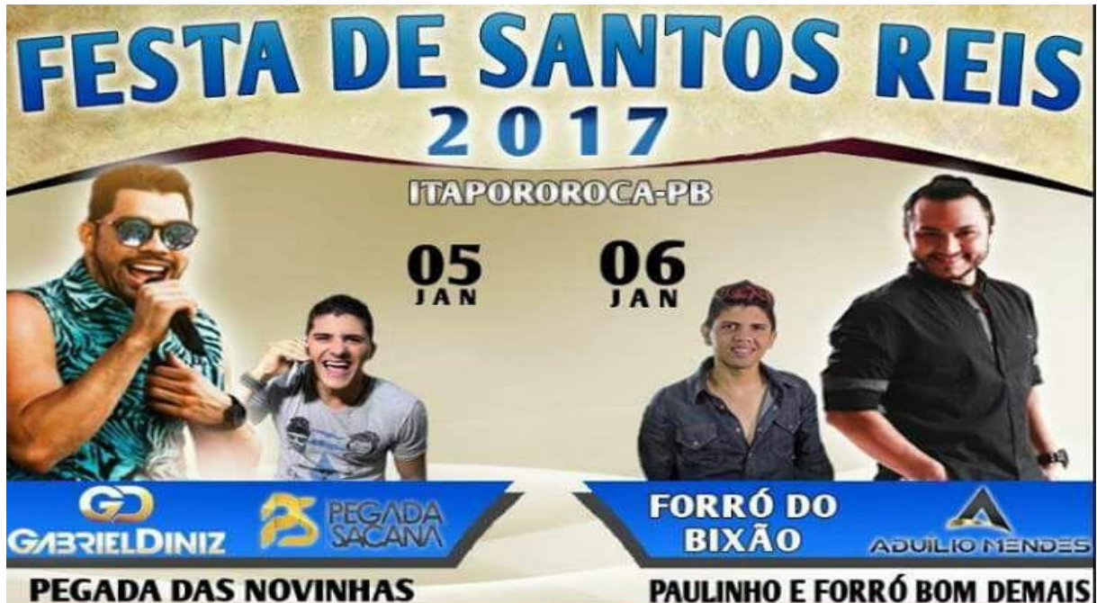
Figura 7 –Cartaz da Festa de Santos Reis

A parte religiosa continuou acontecendo em dois dias com missas na paróquia São João Batista, que é a igreja matriz, localizada no Centro de Itapororoca, como nos anos anteriores.