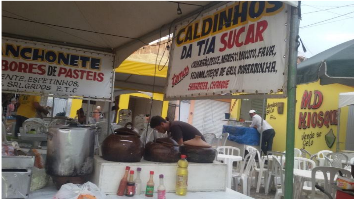
Figura 5 –Uma das barracas da festa

A montagem dos aparatos para o acontecimento da festa profana inicia-se pela madrugada, portanto às 5:30 da manhã, o palco, a iluminação, e mais tarde às 15h chega a aparelhagem de som e os banheiros químicos para os visitantes que ficam em lugar mais afastado da festa, por causa do odor quando se é muito usado.