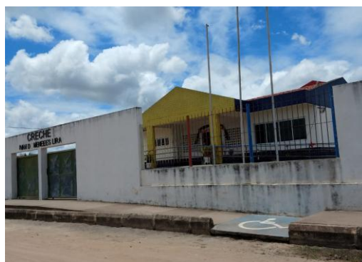
Frente Creche Ivan de M. Lira