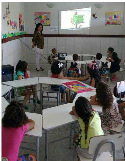
Hora do desenho animado