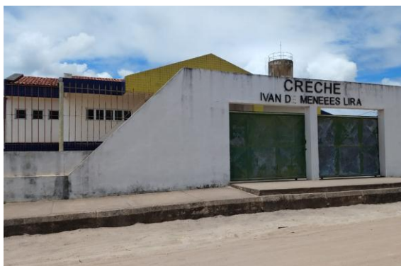
Frente Creche Ivan de M. Lira

O local escolhido para o desenvolvimento da pesquisa foi a Creche Ivan de Menezes Lira, na Cidade de Mataraca – PB, onde os educadores trabalham com crianças de 01 ano e seis meses até 04 anos de idade. Participaram da pesquisa 08 educadoras todas do sexo feminino com idade entre 30 a 45 anos e com atuação na área entre 02 e 08 anos, todas formadas em pedagogia, 03 delas com especialização em psicopedagogia.