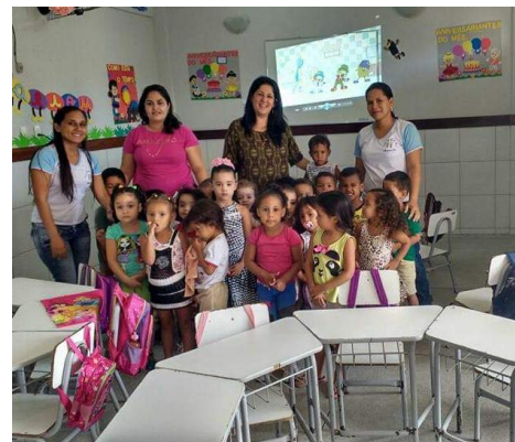
Hora do desenho animado