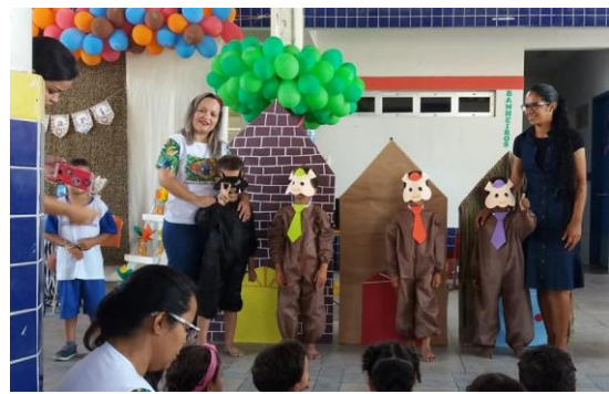
Teatrinho Os 03 Porquinhos

Acima algumas fotos da Creche Ivan de Menezes Lira, ela é bem ampla tem a parte do parquinho, a caixa de areia, banheiros largos, bebedouros do tamanho ideal para as crianças, ou seja, é um ambiente atrativo para as crianças. Percebe-se a interação dos educadores com seus alunos, sempre é usado o retroprojetor para que as crianças possam assistir desenhos animados, o som é usado para as crianças dançarem e na hora da leitura onde as educadoras junto com os alunos se fantasiam e contam a historinha como um teatrinho.