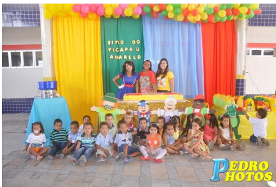
Teatro Sitio do Picapau Amarelo