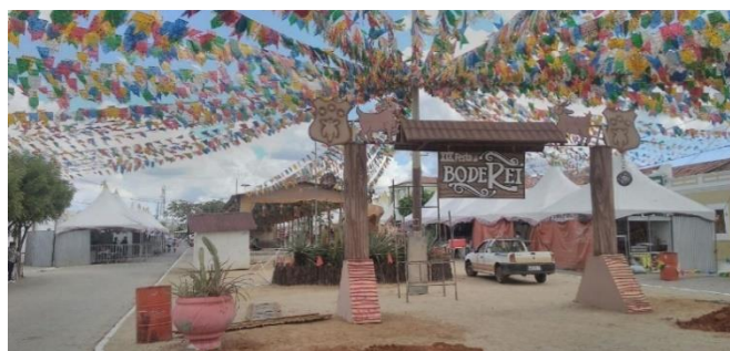
Figura 1: Entrada e estrutura da Festa do Bode Rei, Cabaceiras, Paraíba, 2017

Cabaceiras, Paraíba, 2017.