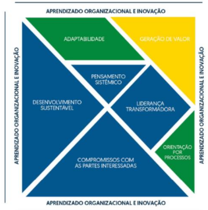
Figura 1-Modelo de Excelência da Gestão (MEG) da 21ª Edição.