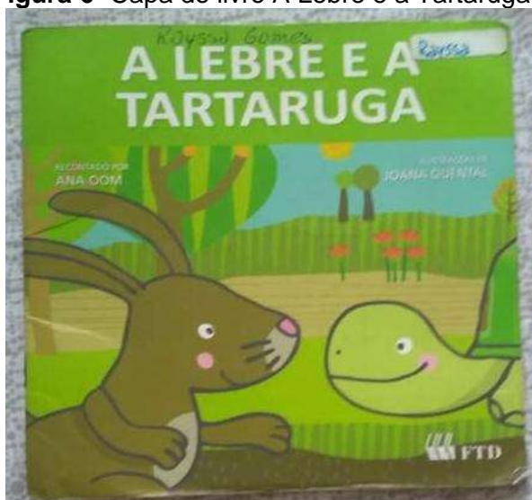
Figura 6- Capa do livro A Lebre e a Tartaruga