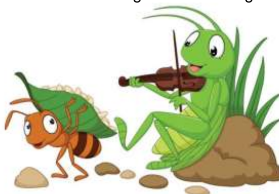
Figura 1- Fábula a Cigarra e a Formiga