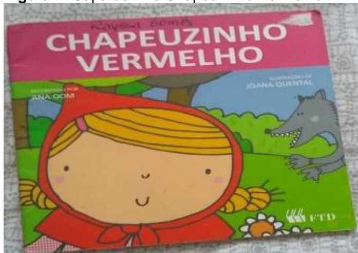
Figura 4- Capa do livro Chapeuzinho Vermelho