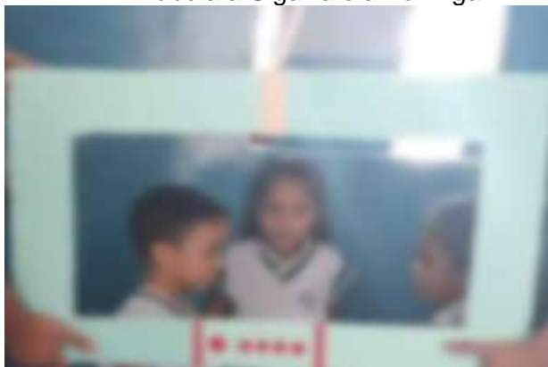
Figura 3- Momento de recontar a história fábula a Cigarra e a Formiga