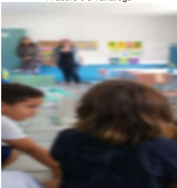
Figura 7- Momento contação de história A Lebre e a Tartaruga

Então, considerando a contação de histórias como uma atividade que deve ser realizada de forma lúdica, de acordo o que foi posto, pode-se afirmar, sem sombra de dúvida, que momentos de contação de história estimulam, sim, a criança a novas perspectivas e a novos desafios em outros ambientes, exercitando suas formas de expressar o que foi compreendido da história contada.