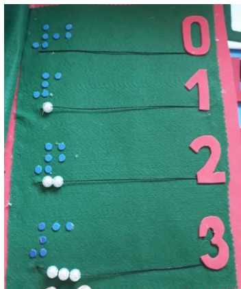
Figura 4 – Atividade de matemática