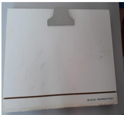
Figura 1 – Plano inclinado