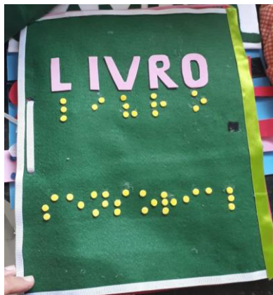
Figura 3 – Capa do Livro Sensorial

Seguem três imagens – figuras 3, 4 e 5 - do Livro Sensorial produzido.