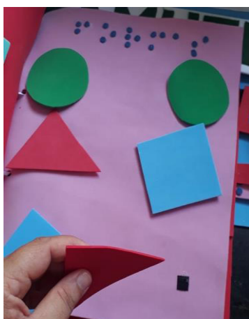
Figura 5 – Atividade de formas geométricas