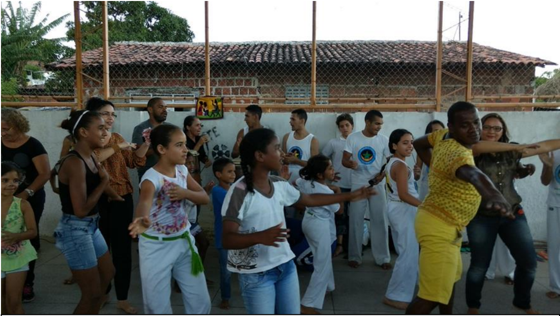
EEEF Ana Higina – Celebração do Dia das Crianças. 2016-2018 * Data indefinida