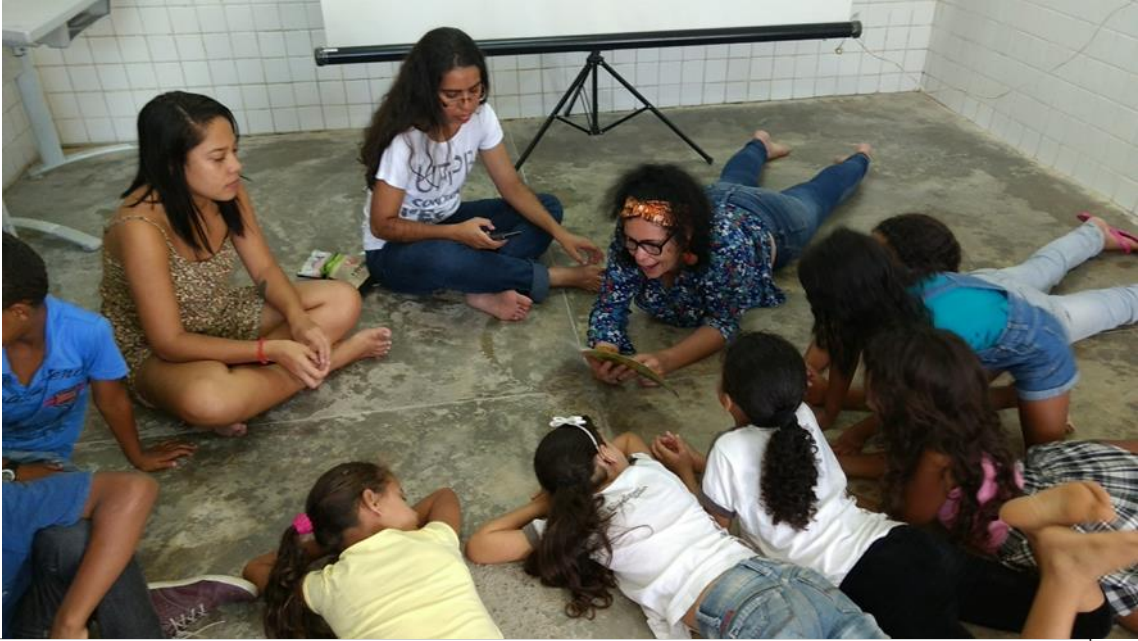
EEEF Ana Higina – Encontro Nordeste de Capoeira Angola Palmares/Oficina de contação de histórias, 2016-2018. * Data indefinida.