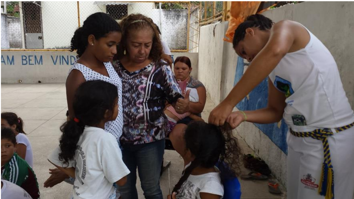
EEEF Ana Higina – Encontro Nordeste de Capoeira Angola Palmares/Oficina de penteado afro, 2016-2018. * Data indefinida.