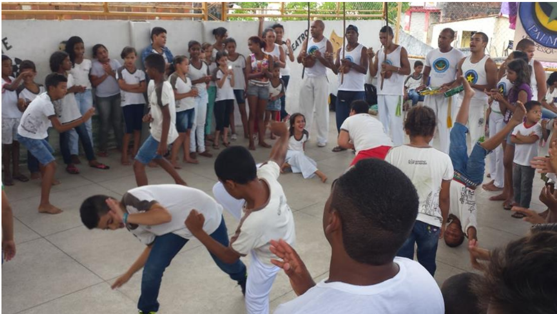
EEEF Ana Higina – Encontro Nordeste de Capoeira Angola Palmares/Oficina de Capoeira, 2016-2018. * Data indefinida.