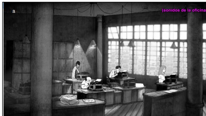
Figura 7: Capturas de tela “a” referentes a descrição dos efeitos sonoros e “b” da descrição da música.

As descrições de efeitos sonoros ficaram na parte superior direita da tela, em letras minúsculas e entre parêntesis como a norma requer. As descrições de músicas tiveram quase as mesmas configurações, exceto que estão fora dos parênteses, também como a AENOR (2013) pede. As figuras 7 “a” e “b” ilustram esse aspecto de forma clara: