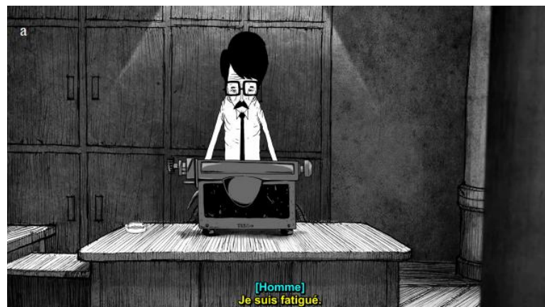
Figura 8: Capturas de tela referentes a “a” identificação do falante e de vozes em off, “b” referentes aos efeitos sonoros e traduções interlinguísticas e a “c” como representação das músicas.

Por último, a legenda francesa se diferenciou das demais por suas cores: amarela para o falante, ciano para indicar voz em off , vermelho para sons de efeitos sonoros, magenta para música, e verde para traduções interlinguísticas de imagens. Todas as legendas ficaram em negrito. A figura 8 apresenta claramente essas configurações: