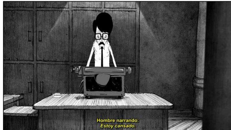
Figura 6: Captura de tela referente a identificação do falante da legenda espanhol

Na legenda em espanhol, optei por deixa-la na cor amarela, e em negrito (notou-se em todas as legendas que a leitura fica mais fácil em negrito) seguindo ao máximo as regras da UNE 153.010 (AENOR, 2013) no que se refere à posição da legenda, cor, sincronia e segmentação. A figura 7 representa a identificação do falante: