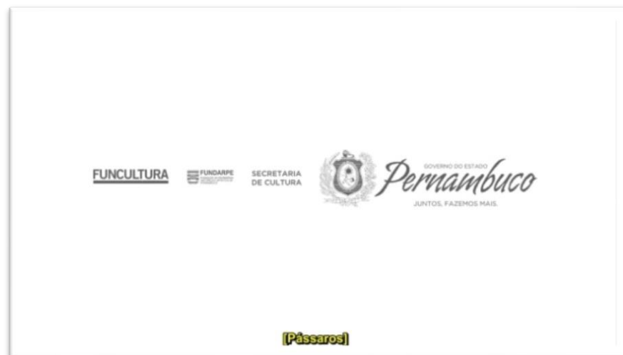
Figura 1: Captura de tela referente ao contraste da tela.

A legenda em língua portuguesa, optei por deixá-la na cor amarela para que houvesse um bom contraste, visto que o curta metragem foi produzido em preto e branco, contando com algumas cenas totalmente em branco, o que ocasionaria em pouca visibilidade do espectador. A figura 1 representa de forma clara a questão do contraste: