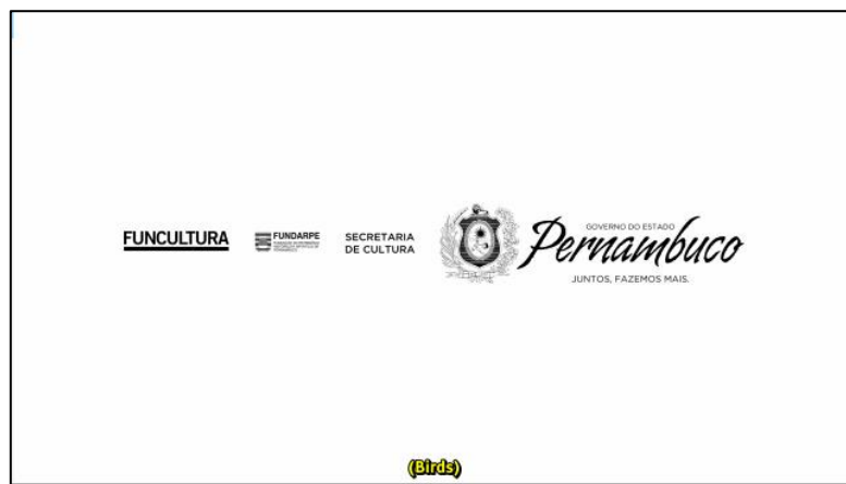
Figura 4: Captura de tela da legenda inglesa referente ao contraste.

Utilizei a cor amarela (em negrito) na legenda inglês, pelos mesmos motivos da legenda português em relação ao contraste, e por ser mais comum, apesar de não existir regulamentação que imponha cor da legenda na legendagem em inglês, porém se existissem outros personagens, utilizaria outras cores como magenta, verde, ou ciano, (ou ciano) uso permitido pela Oftcom (2017), mas não é o caso. Também escolhi deixar a fonte em tamanho 30 para que não houvesse dificuldade de visualização e leitura em uma distância considerável.