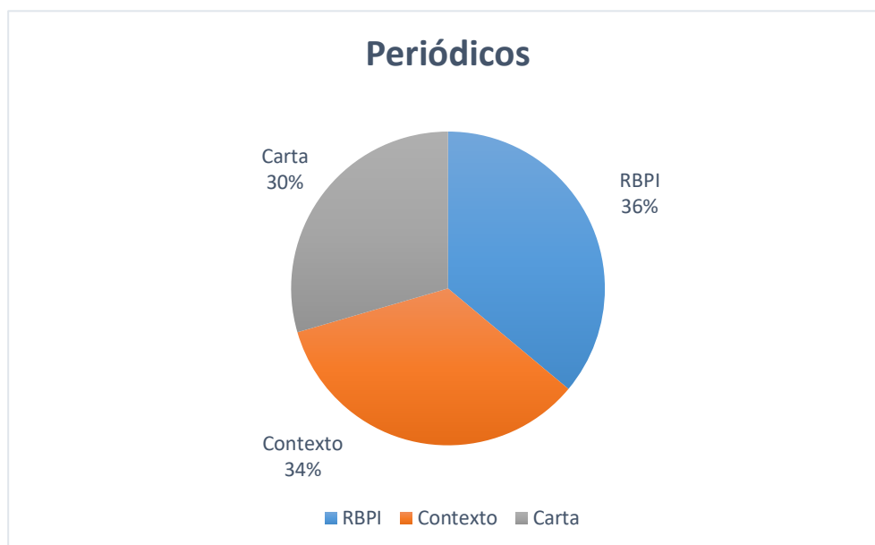
Gráfico I – Artigos analisados por periódico (2014)