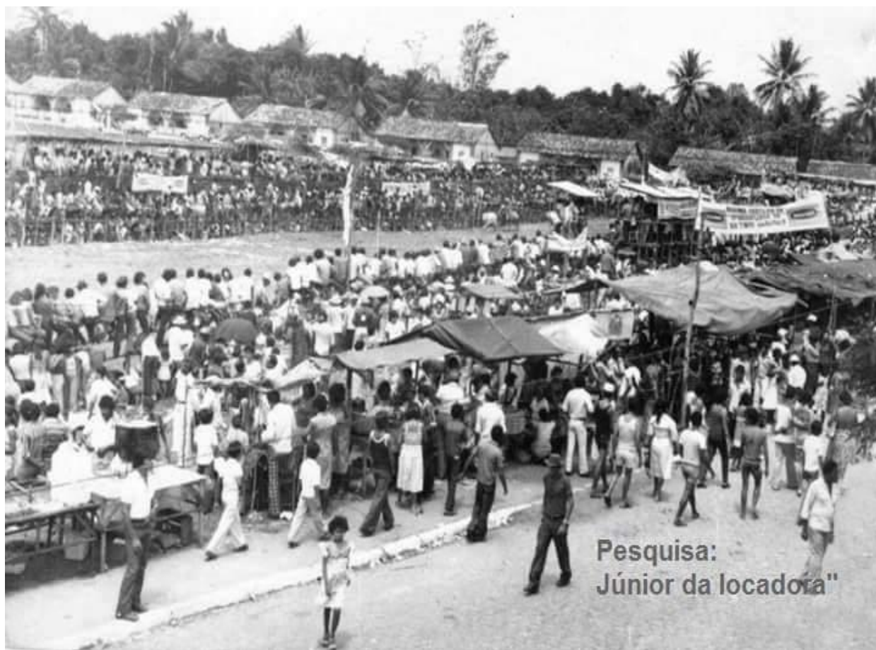
Figura 04: Imagem da Vaquejada na sua 19ª edição, no ano de 1967 na Rua Formosa.