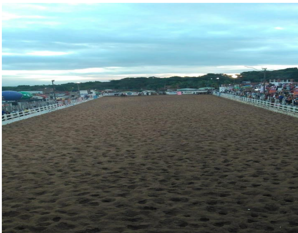
Figura 03: Foto do pátio de vaquejada no dia 08.09. 2019.