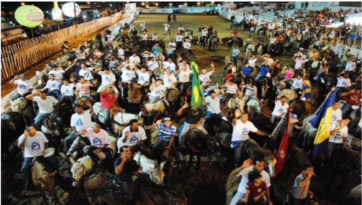
FIGURA 6: Imagem da cavalgada na chegada ao pátio, foto tirada em 07.09.2013.

Fonte: http://www.paraibacriativa.com.br/artista/vaquejada-da-independencia-de-rio-tinto/ . Acesso em maio de 2018.