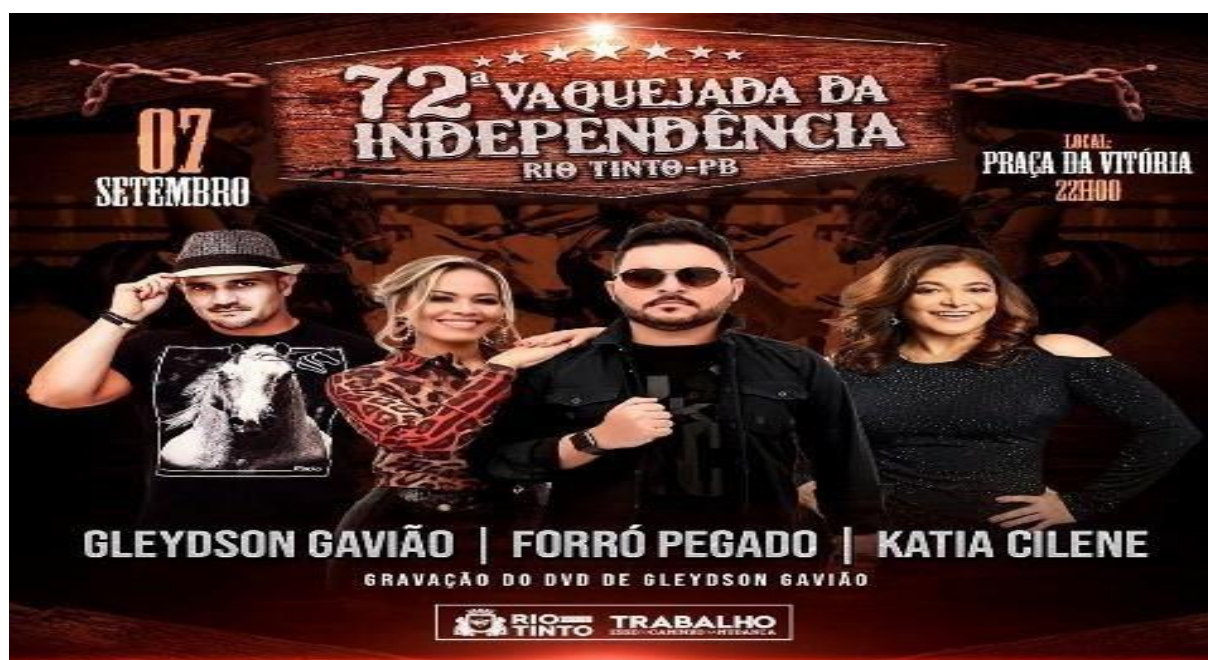
FIGURA 7: Imagem do cartaz oficial da festa de 2019.

o ano de 2017 havia a Festa do Vaqueiro que era realizado na Orion Show (antigo cinema da cidade, hoje casa de shows).