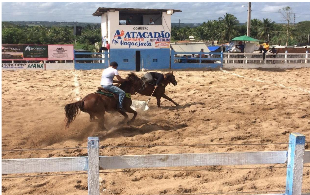
Figura 01: Vaqueiros encerrando o boi, durante a vaquejada em Rio Tinto - PB, no dia 08.09.2019.

uma área demarcada por linhas de cal, entretanto, muitos ativistas protetores dos direitos dos animais acreditam que essa prática é um sofrimento para o gado, já que muitos desses animais têm seus rabos arrancados nas corridas, entre outros ferimentos. Apesar do aumento de certa fiscalização das vaquejadas, os ferimentos ainda são recorrentes, e difíceis de serem evitados, se consideramos a força necessária para derrubar o animal durante sua corrida.