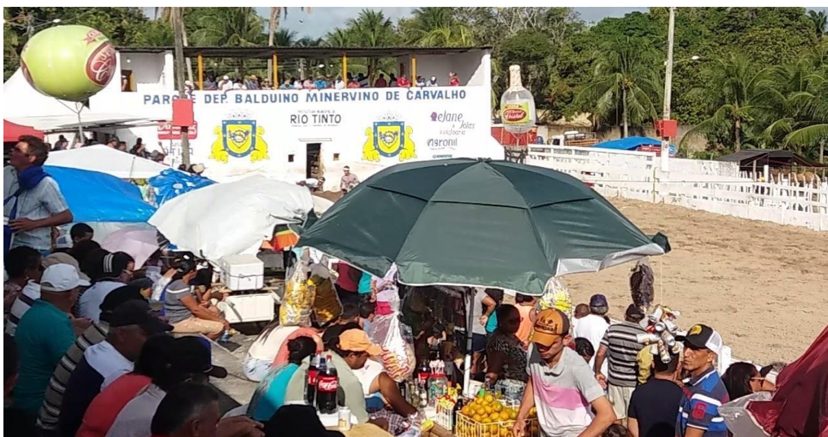
FIGURA 9: Imagem do patio onde mostra as pessoas assistindo o evento enquanto outros vendem.

Sob o ponto de vista econômico, é inegável que a vaquejada se trata de um forte fator de renda no estado do Ceará, assim como em outros estados do Nordeste brasileiro, a gerar, inclusive, apreciáveis números de empregos e fomento à economia local. Para os defensores da vaquejada, não se enxerga na Lei nº 15.299/2013 agressões ao meio ambiente, ou como ela despretegeria a fauna, prejudicaria a função ecológica, provocaria extinção de espécies ou submeteria animais à crueldade (Filho, Leite, Lima ,2015, p. 68).