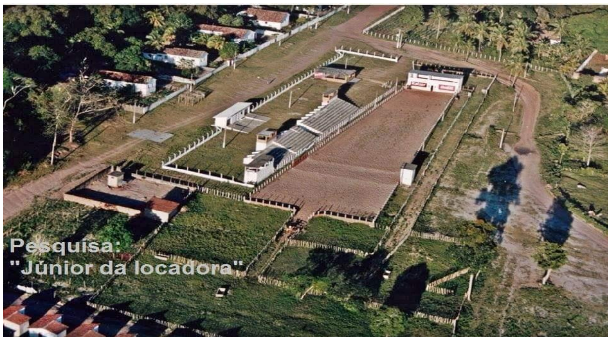
Figura 02: Foto do pátio nos anos 90, logo após sua construção. Fonte: Acervo pessoal de Junior da Locadora. Acesso em maio de 2019.