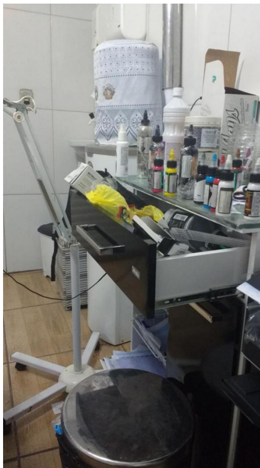
FOTOGRAFIA 2- Material de trabalho (tintas, agulhas, biqueiras etc)

posições através de mecanismos hidráulicos, onde o cliente pode ficar melhor apoiado, uma pia para lavar o excesso de tinta, o estúdio conta também com câmeras de segurança e ar condicionado.