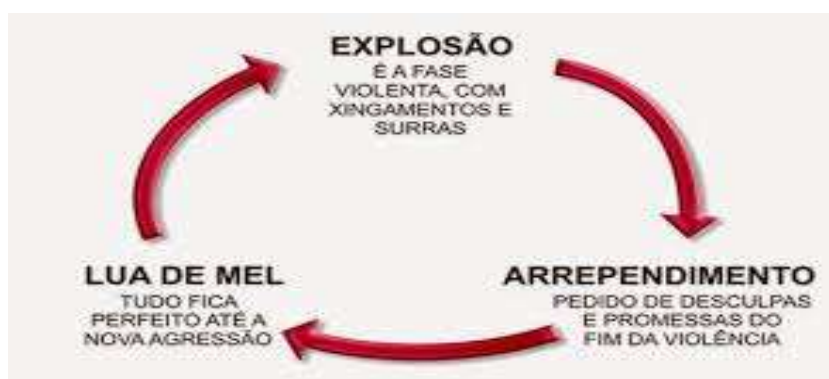
Imagem 1 - Ciclo de Violência

Nesta lógica, Diniz (2019, s/p) destaca que “[...] o ciclo da violência apresenta 4 fases [...] 1) fase da tensão, 2) fase de agressão, 3) fase de desculpas e 4) fase de reconciliação.”