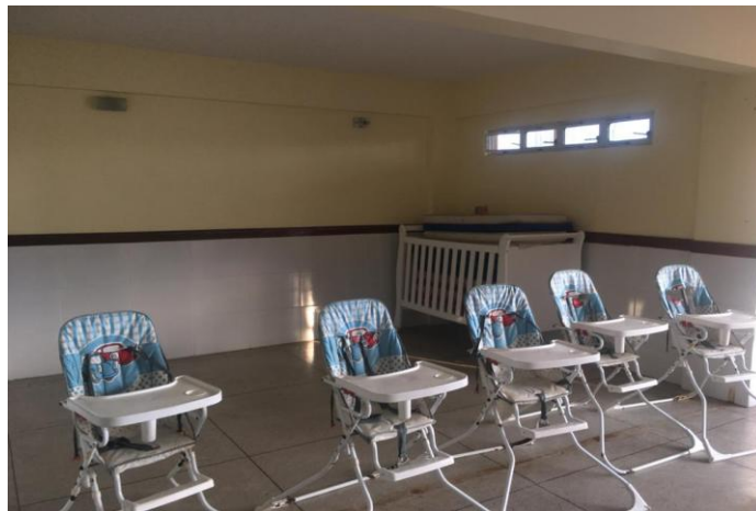
Foto 05 - Espaço da sala de referência pesquisada com cadeirões.