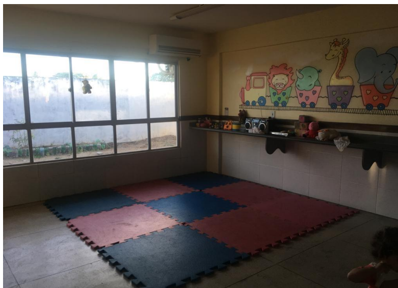
Foto 03 - Espaço na Sala de referência com os tatames, pia e janelas.

A sala de referência do berçário contava com uma estrutura ampla e arejada, com grandes janelas, baixas dando acessibilidade as crianças para observar o salário, continha um ar condicionado mas estava quebrado, então estavam utilizando um ventilador, próximo das janelas possuía uma grande bancada de mármore com uma pia, com alguns brinquedos organizados, bonecas, bichos de pelúcia e um aparelho de som, no chão estava várias peças de tatame, onde as crianças permaneciam a grande parte do tempo, onde aconteciam suas interações, brincando e realizando as refeições.