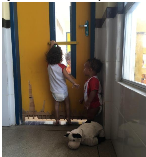
Foto 08 - Bebês interagindo com outros bebês na porta da sala de referência e solário.