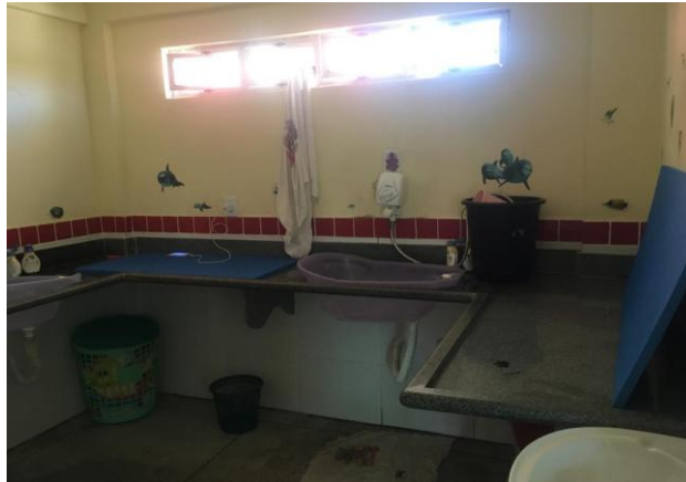
Foto 06 - Banheiro da sala de referência pesquisada.