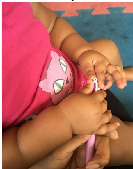
Foto 12 - Bebê interagindo com a caneta.