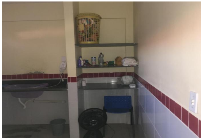
Foto 07 - Banheiro da sala de referência pesquisada.