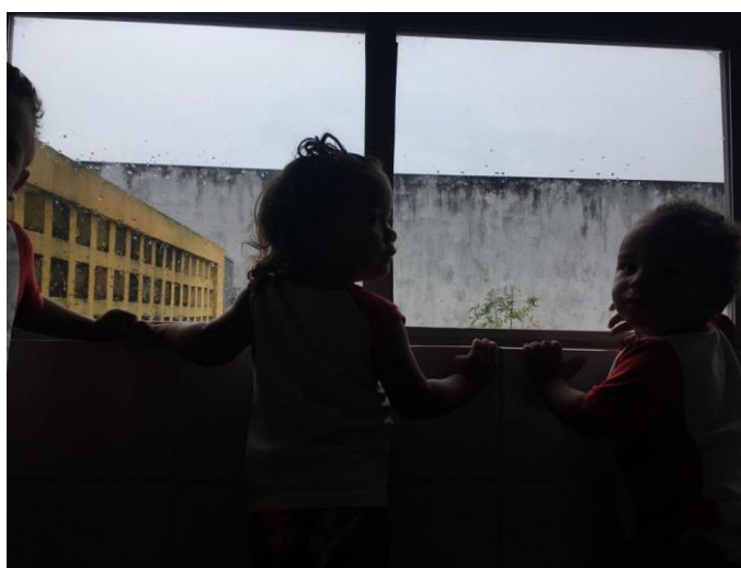
Foto 09 - Bebês observando a chuva pela janela da sala de referência