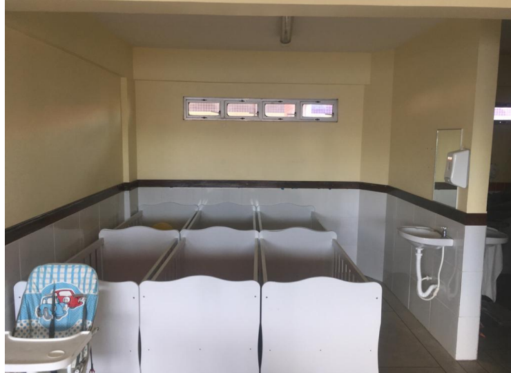
Foto 04 - Espaço com os berços na sala de referência pesquisada.

eram mantidos de “repouso”, em um outro canto da sala permanecia outro berço que comportava os colchões, que eram retirados no momento do sono e eram colocados ao chão.