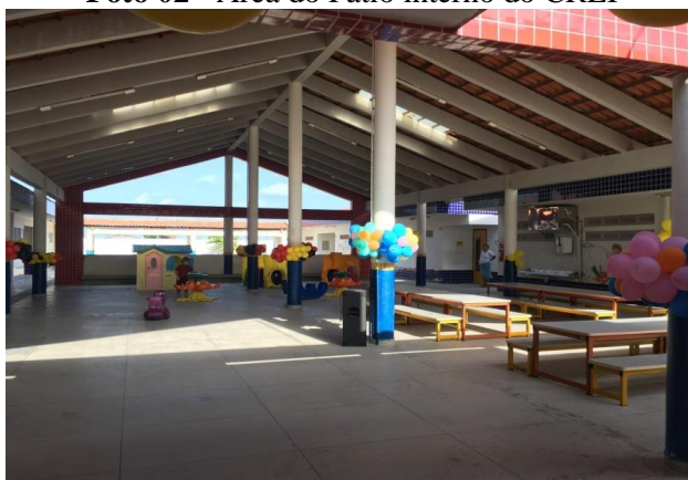
Foto 02 - Área do Pátio interno do CREI