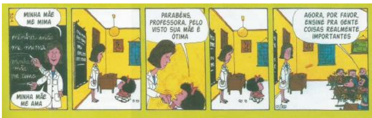
Figura 1 – Tirinha de Mafalda