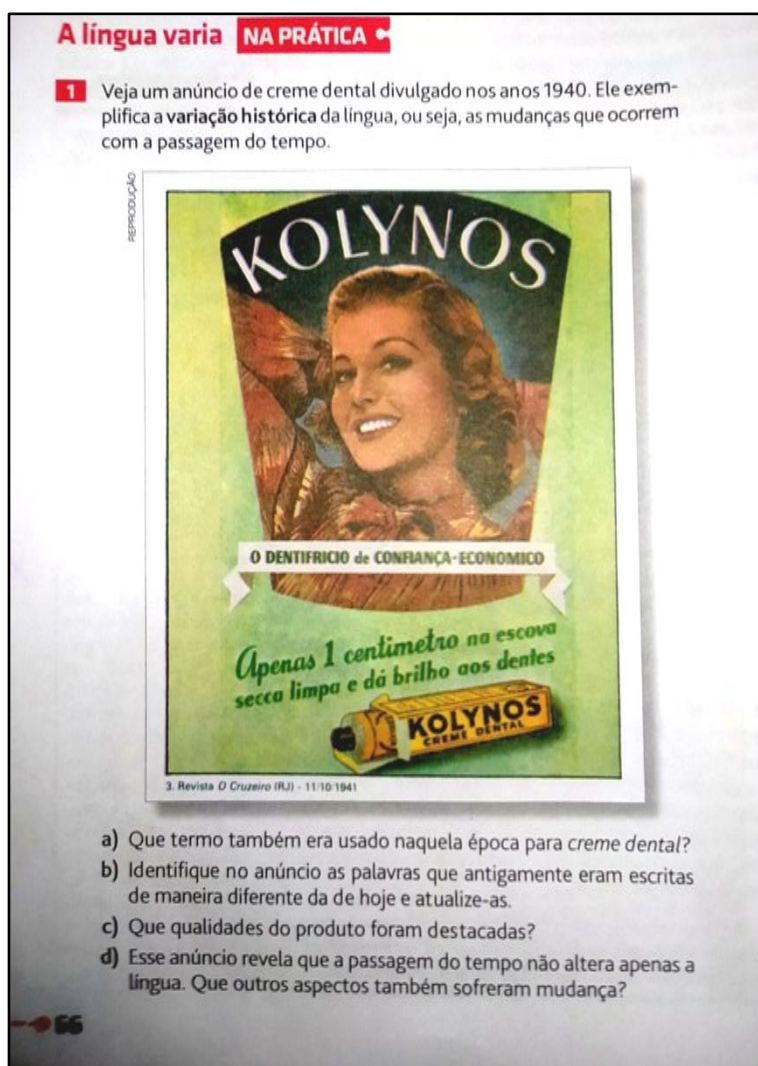
Figura 3 - Exercício 1 sobre variação linguística (LD 2018)