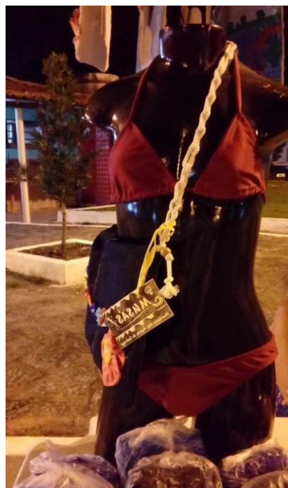
Arquivo do grupo MUSÁS (2018)