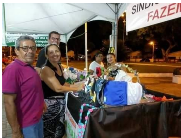
Arquivo do grupo MUSÁS (2017)