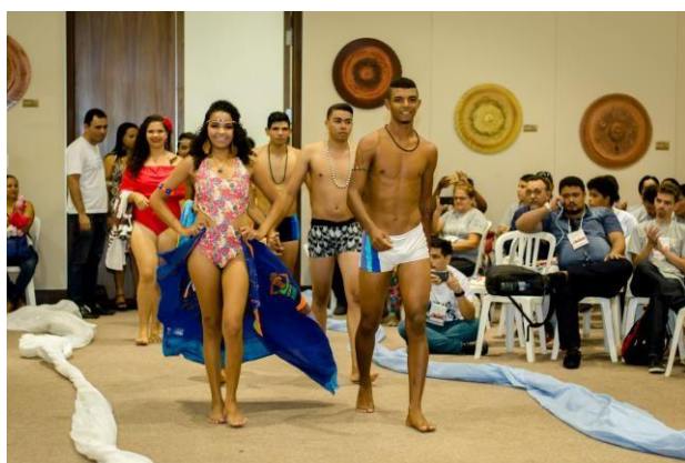
Arquivo do grupo MUSÁS (2017)