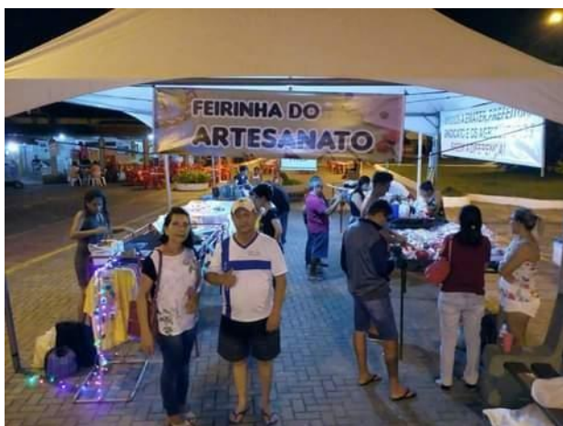
Arquivo do grupo MUSÁS (2017)