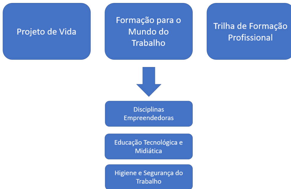
Figura 1 – Estrutura do itinerário formativo