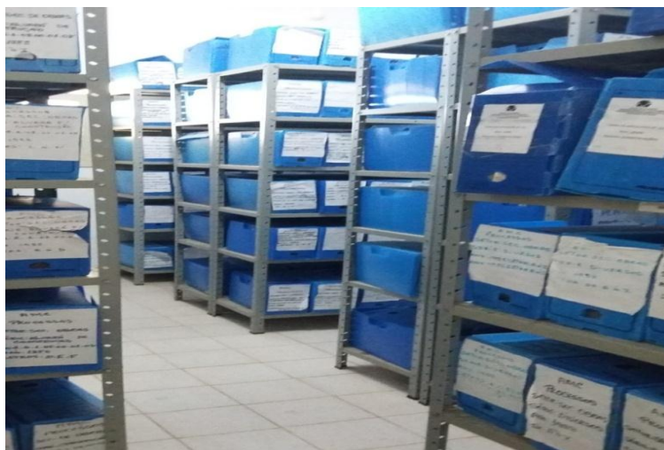
Figura 3 – Acervo do arquivo