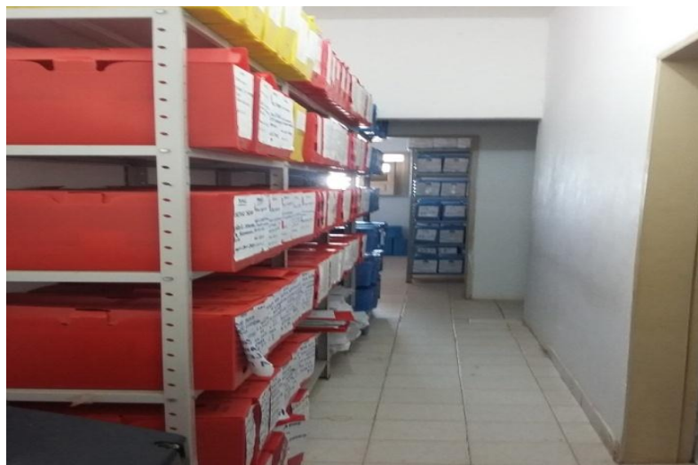
Figura 2 – Acesso interno do arquivo

O Arquivo Geral Municipal de Cabedelo - PB tem seu acervo repleto de documentos de todas as secretarias que compõem a Prefeitura de Cabedelo - PB, o mesmo é responsável pela guarda de toda a documentação de idade permanente a corrente.