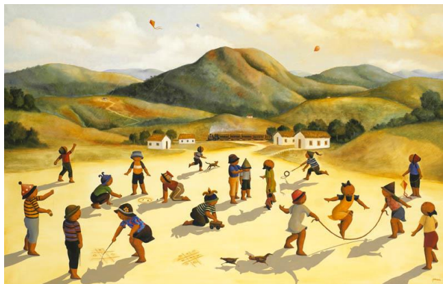
Cândido Portinari Brincadeiras de crianças s/d