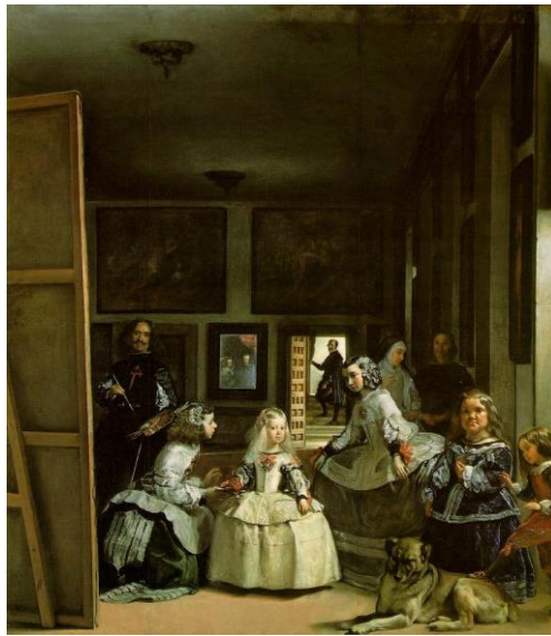
Diego Velázquez Las Meninas 1656 Oil on canvas 10'5"x9' Located in Museo del Prado, Madrid Spanish Baroque

“As meninas ”, de Diego Velázquez, abre esta parte da fundamentação teórica por nos remeter à imagem da criança pequena representada em um recorte temporal, no qual a criança é vista como um adulto em miniatura, um dos aspectos das reflexões realizadas neste estudo sobre a visão social da criança ao longo do tempo.