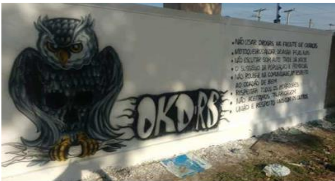
Figura 3: Regras de socialização imposta pela OKD