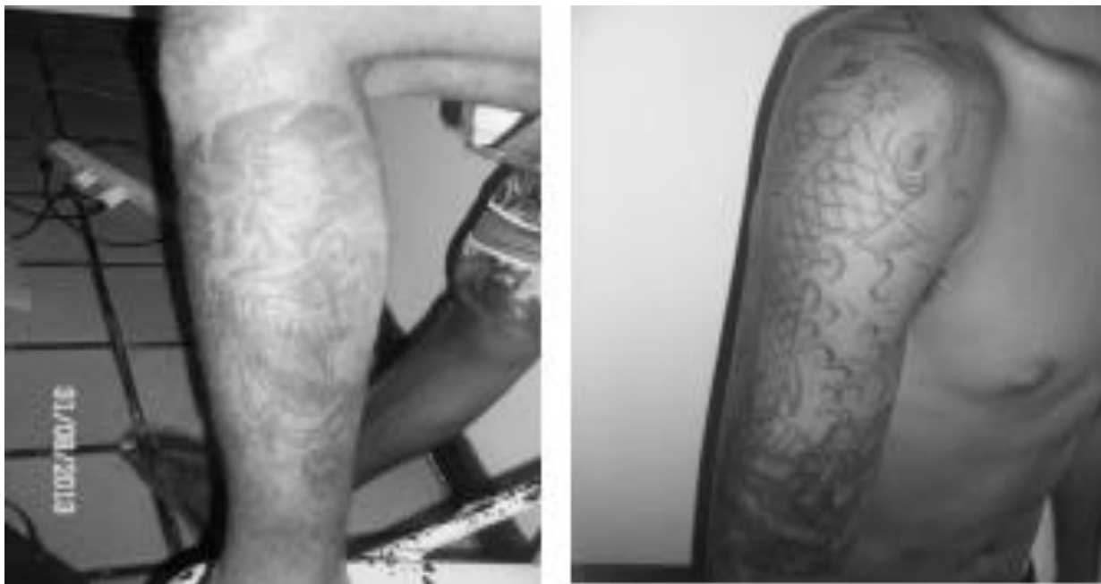
Figura 2 – Símbolos das facções criminosas da Paraíba