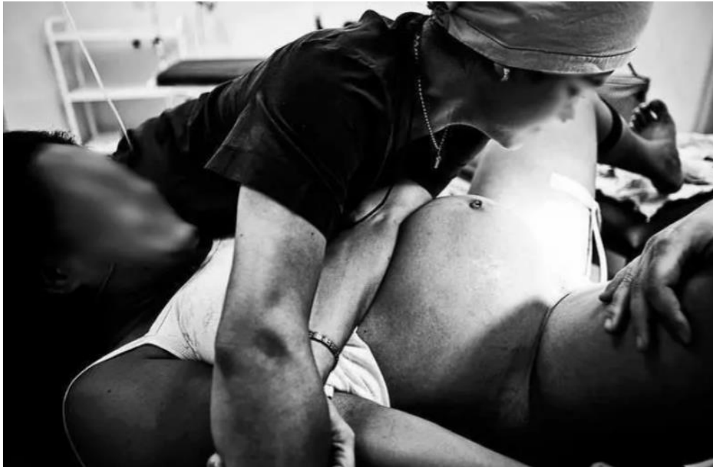
FIGURA 2 – MANOBRA DE KRISTELLER