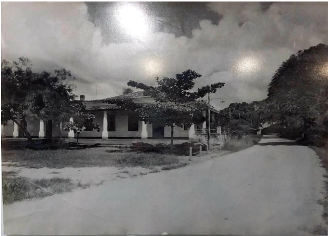
Figura 5 – Engenho Corredor, Pilar-PB