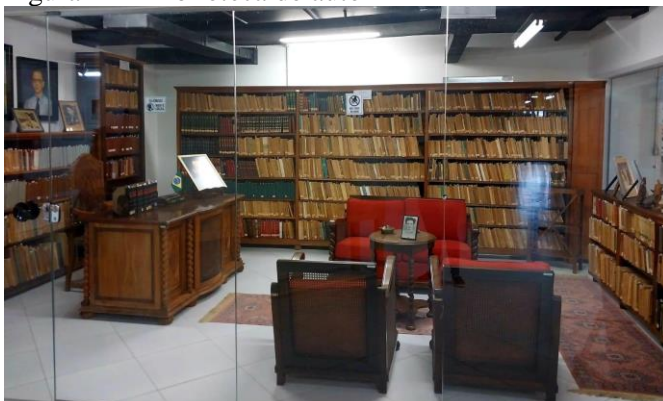
Figura 2 — Biblioteca do autor