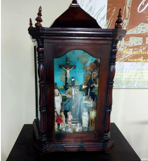
Figura 7 – Oratório do Engenho Corredor

olhar para o mundo. Era assim a religião do engenho onde me criei. (REGO, 2020, p. 57).