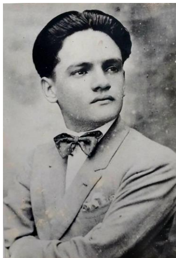
Figura 1 — José Lins do Rego jovem 1