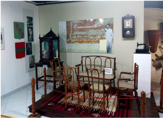
Figura 6 – Móveis do Engenho Corredor

A sala de jantar, de mesa comprida ladeada por dois bancos. Havia duas cadeiras de palhinha. Na cadeira do lado sentava-se o meu avô, na cabeceira a visita que chegava. Na parede, bem em cima da secretária de madeira dura, um relógio grande. (REGO, 2008, p. 35-36, grifo nosso).