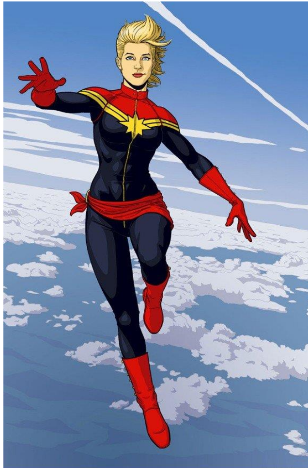
Imagem 18 - Carol Danvers como Capitã Marvel. 26

Como Capitã Marvel, Carol Danvers possui um visual diferente e mais atualizado, lembrando que o discurso possui a necessidade de se ressignificar com o passar dos anos. Nessa fase, a personagem usava roupas onde todo o seu corpo é coberto, tinha o cabelo mais curto e não usava máscara, como podemos ver na imagem 18: