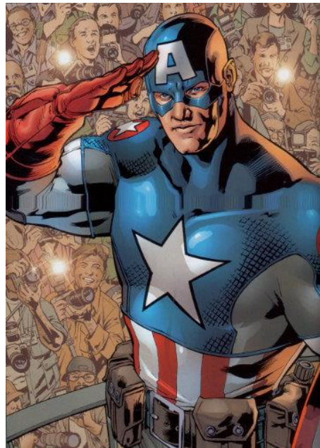
Imagem 5 - Imagem do Capitão América 12

Com o passar dos anos, foi possível notar que as comics de super-heróis passaram a apresentar personagens mais próximos à realidade de seus leitores, como já havíamos dito anteriormente. Isso é importante se formos pensar nas questões identitárias acerca desse gênero. Uma vez que aceitamos o vasto universo de heróis dessas histórias em quadrinhos e consideramos a grande quantidade de pessoas que leem essas histórias, podemos defender que há várias identidades a serem representadas e várias formas de o leitor se identificar com determinados personagens. Como exemplo, usaremos o Capitão América, que pode ser tido como uma grande representação da identidade nacional: