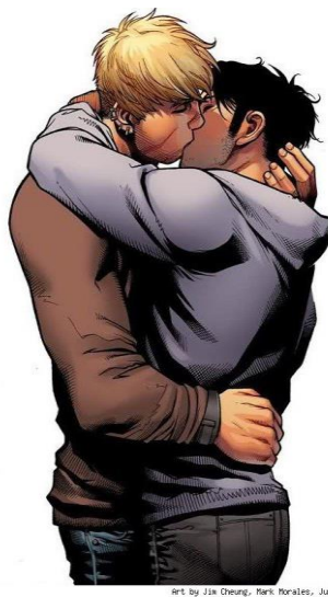
Imagem 6 - Hulkling e Wiccan 13

A variedade de identificações possíveis dentro das comics de super-heróis permite também a afirmação de identidades, mesmo que algumas dessas afirmações se deem apenas pelo fato de essas identidades estarem sendo representadas dentro das histórias. Esse é o caso dos personagens Wiccano e Hulkling, heróis integrantes dos Jovens Vingadores que têm uma relação homoafetiva: