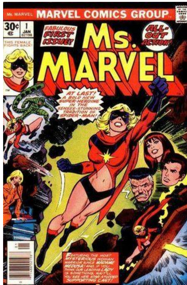
Imagem 17 - Primeira versão da Miss Marvel 25

feminino na sociedade, mesmo que em algumas comics , como a ilustrada a seguir, ela apareça de forma muito sexualizada: