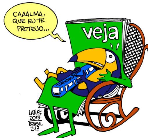
Imagem 1 – Charge de Latuff 7

As charges são geralmente resumidas em um quadrinho e são marcadas pelo exagero, pelas caricaturas das figuras que estão sendo representadas. Têm a intenção de fazer uma crítica social, política, histórica, usando o humor para esse objetivo. O discurso da charge deve ser buscado nos elementos visuais e verbais contidos nela. Tendo essa função de criticar algum aspecto da sociedade ou da política, a charge requer retomadas da parte do leitor, para que o humor possa ser apreendido. Em uma breve análise, mostraremos como funciona a charge: