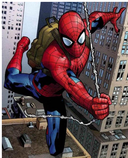
Imagem 8 - Peter Parker como Homem-Aranha 15

Se pensarmos na ideia de que um sujeito se constitui de várias identidades, como aponta Hall (2005), somos capazes de notar que Peter Parker se tornou rapidamente popular porque era capaz de causar identificação não apenas a um tipo de jovem – o jovem estudioso, nerd –, mas continha em sua personalidade características que levavam diversos jovens a se identificarem com ele. Em outras palavras, os jovens que não se identificassem com o estilo visual do personagem teriam outras coisas para se identificarem, como sua personalidade tímida e insegura. Essa identificação se reforça quando Peter Parker vai de um garoto normal a um super-herói, o Homem-Aranha. Os jovens que já se identificavam com o personagem, podem começar a tê-lo como uma inspiração, seguindo a ideia de que um jovem nerd comum e inseguro pode se tornar um herói (mesmo que a expressão “se tornar um herói”, neste caso, não siga ao pé da letra a ideia do contexto da comic e tenha um significado semelhante a “se tornar importante para as pessoas através de suas habilidades/competências”). Essa inspiração é reforçada pela personalidade segura que o personagem apresenta: enquanto combate o crime, Peter Parker apresenta uma personalidade descontraída e bem-humorada, mesmo que não perca seu senso de responsabilidade. Abaixo, na imagem 8, podemos ver Peter Parker como Homem-Aranha: