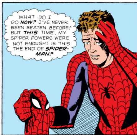
Imagem 9 – Primeira versão de Peter Parker nos quadrinhos 17

Reforçando a ideia de que os discursos vão se modificando na medida em que a história avança, vale dizer que várias outras HQs do mesmo herói foram lançadas desde o primeiro volume, mostrando novamente a história desde o começo, abordada, em alguns casos, de ângulos diferentes – inclusive algumas dessas HQs são consideradas parte de um universo alternativo. Com isso, a aparência do personagem Peter Parker foi se alterando para que a identificação ainda fosse possível mesmo com o passar do tempo, afinal o objetivo do herói de fazer com que os jovens se identificassem com ele tinha que ser mantido, mesmo em momentos diferentes da história. Nas imagens abaixo, podemos ver a evolução gráfica do personagem que ocorreu com o passar dos anos: