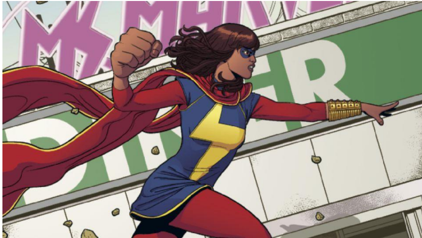
Imagem 19 - Kamala Khan, a nova Miss Marvel. 28

Na imagem 19, podemos ver a aparência da personagem: ela tem a pele um pouco escura, cabelos castanhos e usa uma roupa semelhante a uma veste muçulmana, onde nada além de seus punhos e rosto está exposto (ainda assim, há uma máscara cobrindo parte de seu rosto). Em respeito à sua religião, as roupas não mostram muito de seus detalhes físicos, tendo apenas a função de cobrir o corpo. Esses elementos visuais também trazem sentidos que reforçam a afirmação da identidade muçulmana e retomam uma memória discursiva que resgata os costumes do povo muçulmano no momento em que a personagem não sai de sua crença quando se torna uma super-heróina, afinal, como podemos dizer a partir das considerações de Possenti (2004), a memória discursiva é uma memória coletiva ativada por determinados discursos através da retomada de enunciados passados.