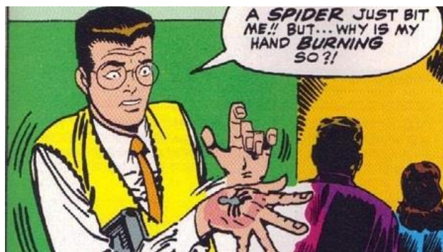
Imagem 7 - Momento em que Peter Parker é picado pela aranha radioativa 14

O primeiro e mais conhecido Homem-Aranha, Peter Parker, é um personagem que ficou bastante popular entre os jovens. Sua origem é diferente da de personagens como o Superman, por exemplo, que é uma existência alienígena cheia de poderes e que beira a invencibilidade. Peter Parker era apenas um jovem humano comum que vivia com os tios Ben e May, em um lugar simples em Nova York. Sua vida só mudou a partir de uma exposição sobre radiologia em que foi com a sua turma da universidade, quando foi picado por uma aranha radioativa e desenvolveu habilidades semelhantes às de uma aranha, como força, capacidade de escalar paredes, agilidade, etc.