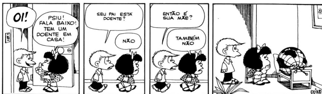
Imagem 2 – Tirinha de Quino - Mafalda 8

Em questão de formato, a tirinha se diferencia da charge por conter mais quadrinhos e por ter mais diálogos. A proposta é a mesma: ativar o humor do leitor, em alguns casos, a partir de críticas sociais. Observemos a tirinha abaixo: