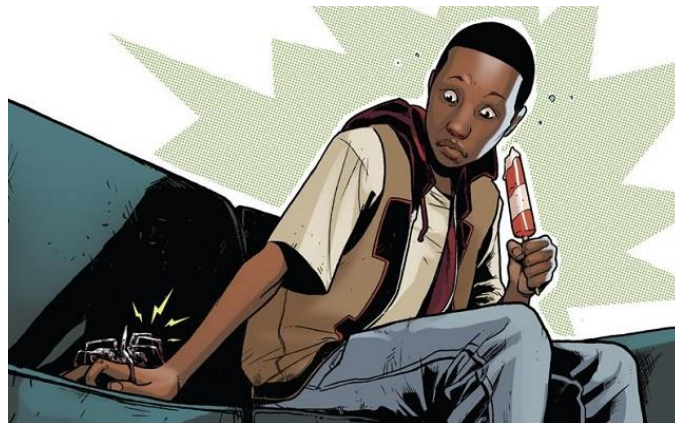
Imagem 11 - Miles Morales sendo picado pela aranha radioativa 18

Essa versão do Homem-Aranha ainda não é tão conhecida e tão popular quanto a sua antecessora, afinal, há todo um marketing voltado para o personagem Peter Parker, uma vez que o mesmo não reside apenas no mundo das comics e já está adaptado em filmes e desenhos animados. Enquanto Parker teve sua origem no ano de 1962, Miles Morales surge pela primeira vez em 2011, aproximadamente 49 anos de diferença. Com tão pouco tempo de história, é esperado que Morales não tenha tanta popularidade, porém não podemos deixar de ressaltar sua importância para a afirmação da identidade, afinal ele é o primeiro Homem-Aranha negro dos quadrinhos. Como o personagem Miles Morales agora ocupa uma posição que até então era do personagem Peter Parker, é pertinente que o analisemos considerando as mudanças que ocorreram entre o primeiro Homem-Aranha e o atual. Começemos a partir da seguinte imagem: