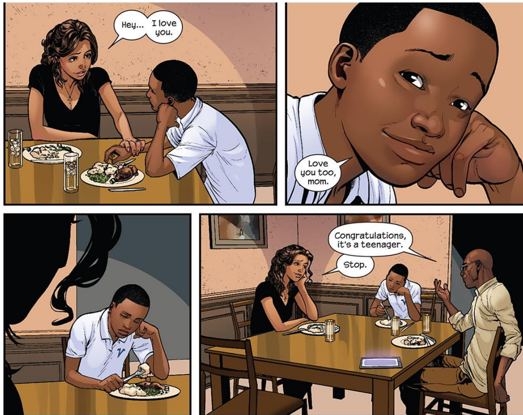
Imagem 13 - Miles Morales com sua família. 20

Para observarmos o contexto familiar do garoto, analisemos a seguinte imagem: