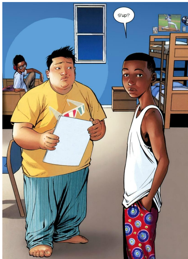
Imagem 14 - Miles Morales, Ganke Lee e Judge 21

Outra forma com a qual a comic consegue afirmar identidades é através dos personagens amigos de quarto de Miles, Ganke Lee e Judge (este se torna ex-colega de quarto no decorrer da história). A imagem seguinte mostra esses personagens: