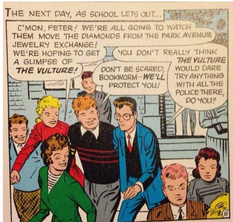
Imagem 12 - Primeira versão da HQ do Homem-Aranha: Apenas personagens brancos presentes. 19

No momento em que surgiu o primeiro Homem-Aranha, os Estados Unidos ainda estavam inseridos em um contexto de segregação racial, que só deixou de existir (em lei) a partir de 1964, graças à Lei dos Direitos Civis, que não permitia mais a separação. Considerando esse momento da história, é possível afirmarmos que a inserção apenas de personagens brancos em volta do personagem Peter Parker, como mostrado na imagem 12, se dá graças à segregação racial da época.