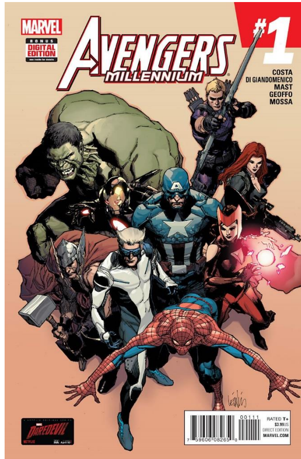
Imagem 4 - Uma das capas da comic Vingadores 11

mundo jovem através de adaptações dos super-heróis em filmes, séries, desenhos animados 10 , etc.