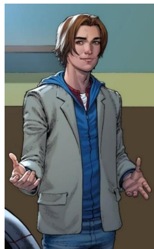
Imagem 10 – Versão Ultimate de Peter Parker 16

A imagem 9 mostra o primeiro Peter Parker, desenhado em 1962, enquanto na imagem 10 está o Peter Parker do Universo Ultimate, um dos universos mais recentes em que o herói aparece. Vale reiterar: não foram apenas os recursos gráficos que foram atualizados desde a primeira comic do Homem-Aranha até a última. Com o passar dos tempos, os discursos também